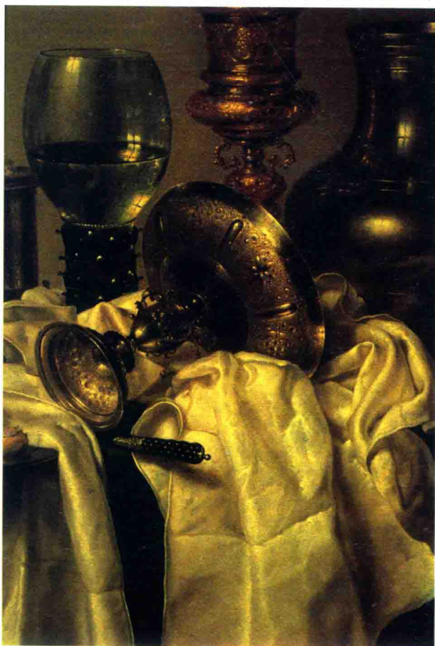
图（1）荷兰画家海达的静物画局部