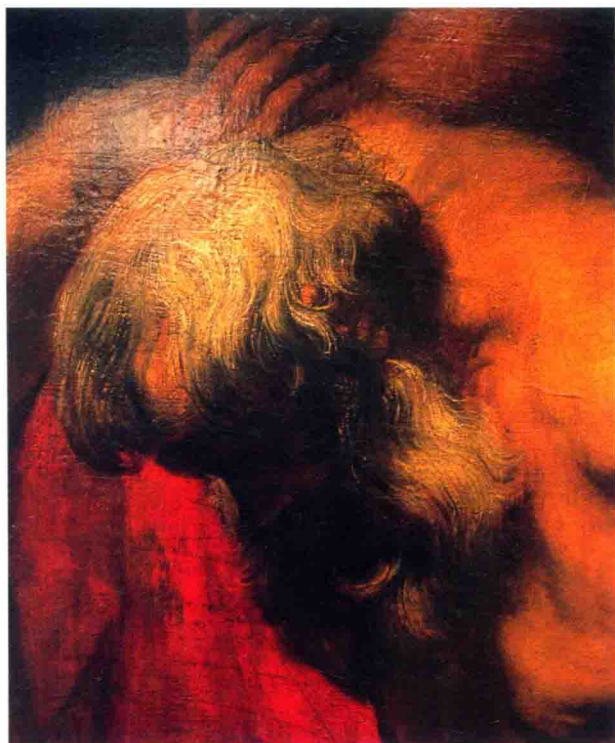
图（2）佛兰德斯画家凡·代克作品局部

层次美感不仅是一种审美情感的寄托，它也是一种技法的结果。在油画还未诞生之前，蛋胶画已经开始在它的最后完成阶段被涂上一层油以起到色彩饱和与保护作用，人们于是便开始尝试直接用油调色，油与色粉的调和成为油画最早的开端。但那个时期仍然没有出现纯粹的油画，多是在丹配拉上罩