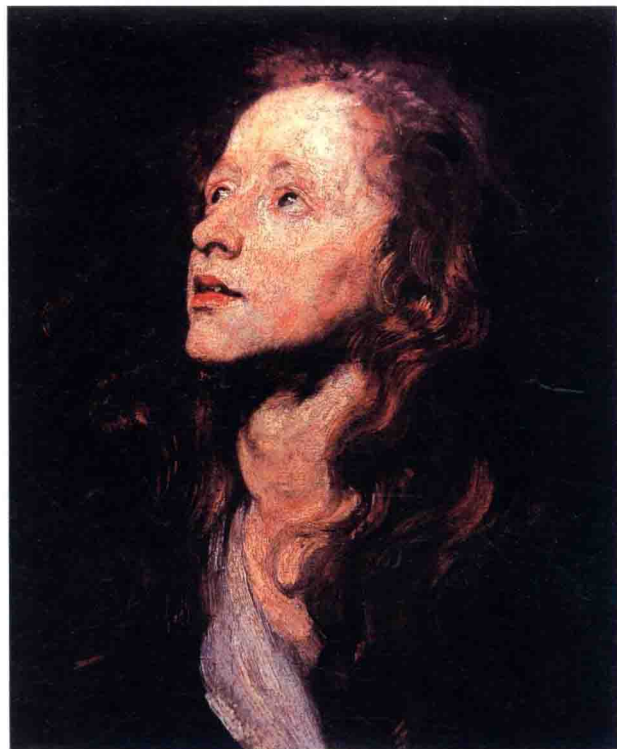
图(8) 佛兰德斯画家凡·代克作品

会觉得它的每一处都充满了对肌理的绝佳表现,而且秩序感极强。在形体的塑造上,由于是逐层进行,厚与薄被限制在很小的跨度之间,笔触的变化也蕴藏于微妙的过渡之中,这些都只能增加表现上的难度。但我们却往往能发现在这些微差中的千变万化。可以说正是由于它的肌理的细致入微和无穷变化才造成了它的整体光洁感,也造成了你不能那么轻易地察觉它的轨迹。见图(7)。因此,古典油画的肌理是服从于它的整体需要的,即一种形体、色彩、色层的和谐、圆润及浑然一体的大秩序,肌理是蕴涵于其中的,而不是喧宾夺主,如同故事中的每一个细小情节被娓娓地道来,串连成一部宏篇巨著。