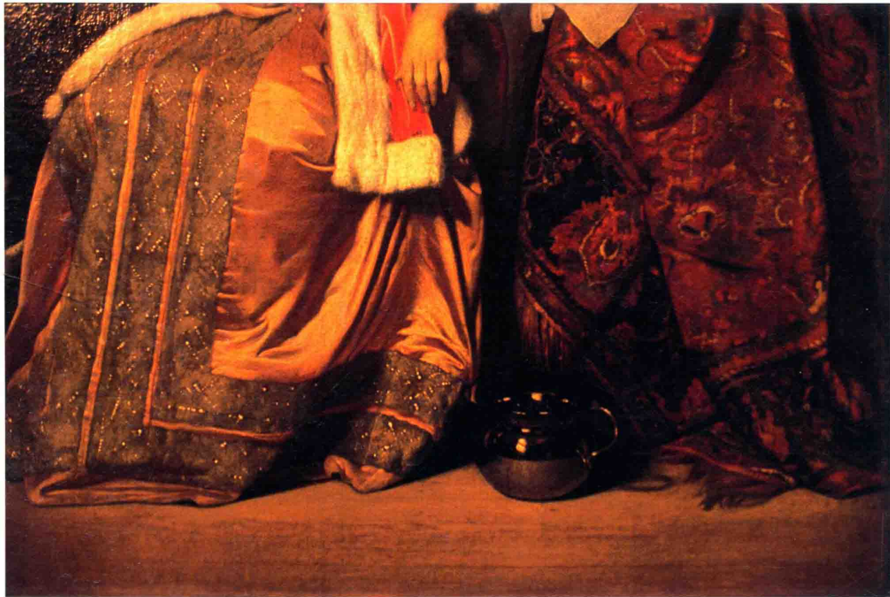
图(9) 荷兰画家卡勃里耶尔·梅许作品局部

入程度上或是作画的方便性上都大大地优越于以前的其他画种，因此油画逐步地取代了它们，并得到了广泛的采用和发展。可以说油画的出现将整个绘画史在再现自然的深度上推进了一大步，同时也将绘画再现自然的审美价值体现了出来。大大地扩展和完善了人的感觉领域和感觉能力，提升了人的感性价值和情感价值，启示着人性在精神层面上的发展。油画极佳的再现性在很大程度上丰富了绘画的表现力，拓宽了表达的范围，揭示出自然对象的深刻性、生动性，同时于其中感到自然的美乃至人的精神之美，使人的感性欲求与理性观念、客观物质与主观精神统一于一种完美的和谐之中。这些都是因为艺术再现自然所产生的具有人文建设意义上的功绩，由此，“自然”在绘画艺术中便具有了神圣而