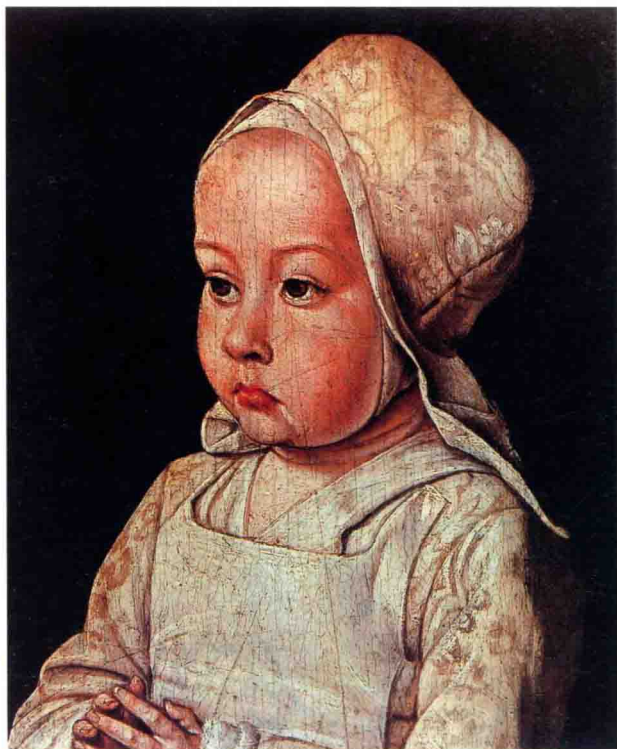
图(7) 画家简亨作品局部