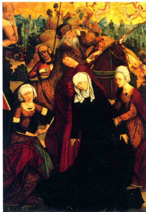
图（3）15世纪佛兰德斯画家作品局部