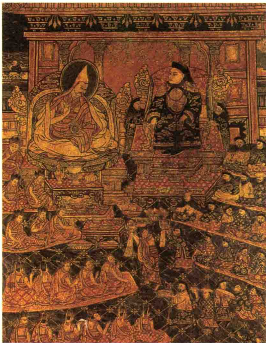
■ 五世达赖觐见顺治帝壁画

藏传佛教 又称藏语系佛教、喇嘛教，是指传入西藏的佛教分支，与汉传佛教、南传佛教并称佛教三大体系。藏传佛教是以大乘佛教为主，其下又可分成密教与显教传承。藏传佛教中并没有小乘佛教传承，但是说一切有部及经量部对藏传佛教的形成，仍有很深远的影响。