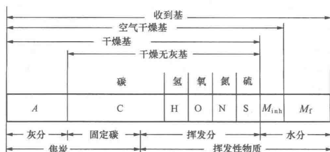
图 2-1 煤成分及基准间的关系