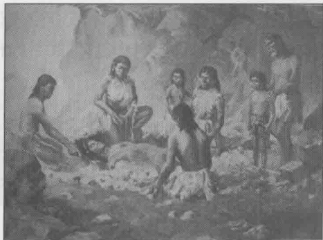
图 1.1 北京周口店山顶洞人葬仪

据考古发现，距今约三万年前的北京周口店山顶洞人已经用穿孔的兽齿、石珠作为装饰品挂在脖子上打扮自己，他们在去世的族人周围撒放红色的赤铁矿粉粒，并用石器和装饰物陪葬，举行原始宗教仪式，期望死者能够超生，这是中国境内发现的最早的葬礼（参见图 1.1、图 1.2）。