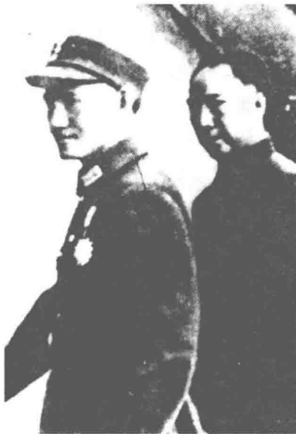
蒋介石同戴笠在一起