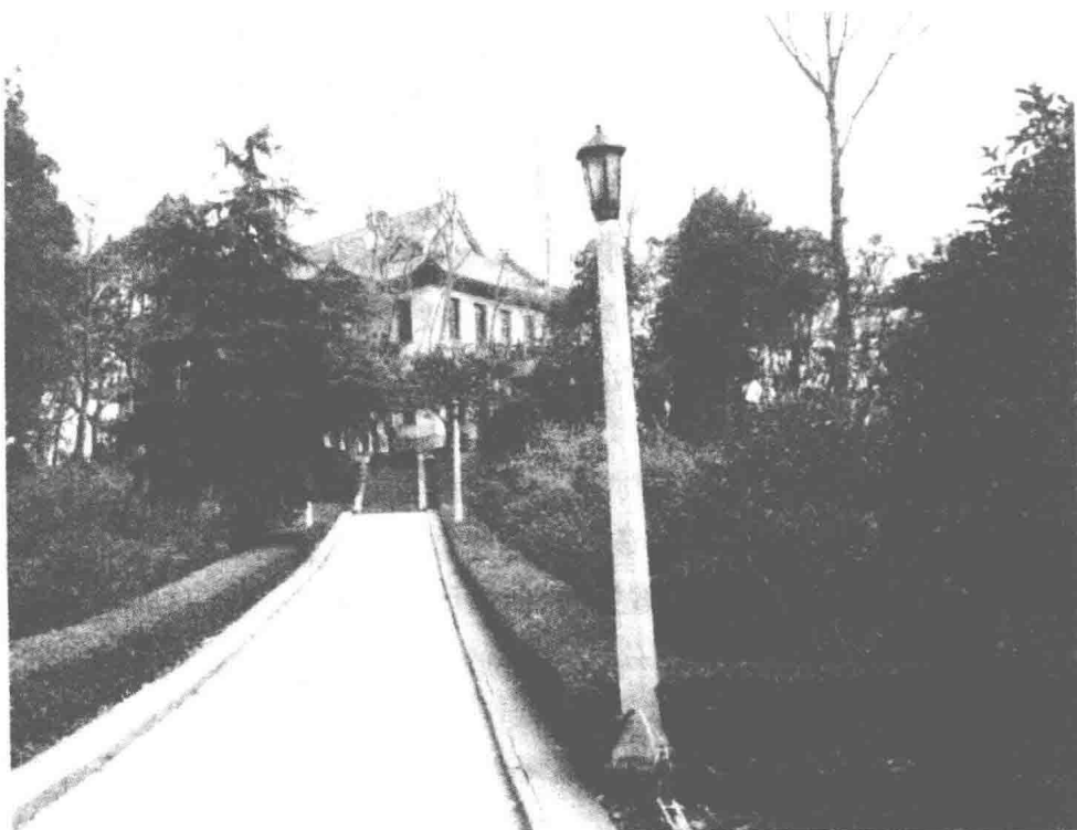
蒋介石位于南京的陵园别墅

由于大多数学生都强烈地提出了反抗日本侵略的狼子野心，蒋介石清楚再回避抗日这个同仇敌忾的敏感问题显然不行了，为此他强调了“攘外必先安内”的政策。他语重心长地对年轻的学生们说：“日本已有50年的侵华准备，装备精良。我华北平原，绵长海岸线和长江水道，都极适于他陆海空军之活动。现代化武器杀伤力极强，机械装备行动迅速。我们虽地大、物博、人众，一点准备没有，有什么用”，“我所能做的是忍辱负重”，“决