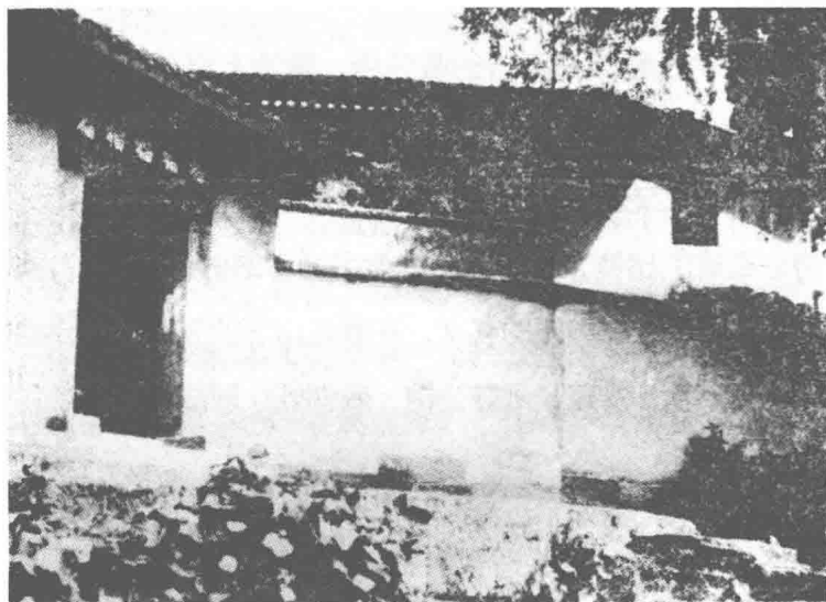
重庆红炉厂蒋家院子囚禁叶挺将军处

从此，军统的监狱系统已经形成：在重庆的有望龙门、白公馆和三处秘密囚室等，在贵州的有息烽监狱。