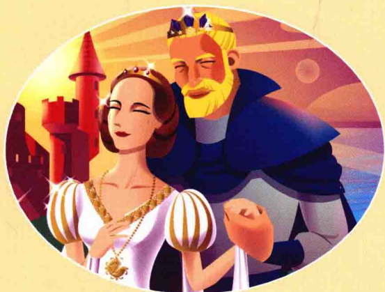
爱德华国王和王后