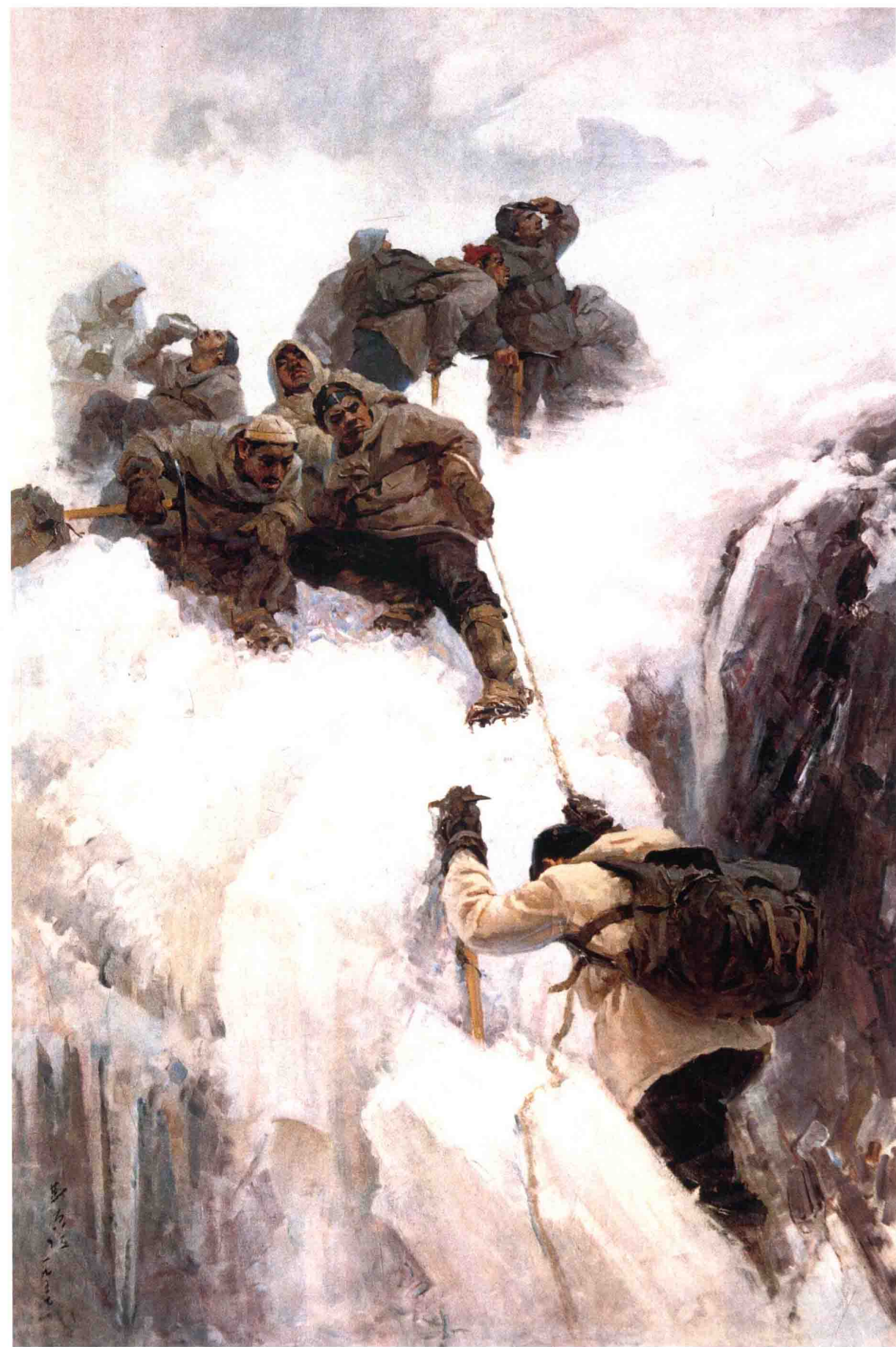
《登上慕士塔格峰》 布面油画 185cm × 140cm 1957年

《登上慕士塔格峰》是表现时事题材的历史画创作，反映中国人第一次登上7000米以上高峰的历史事件。这幅作品，体现了靳尚谊对于外光条件色色彩的研究，同时体现了他对情节性绘画创作中多人物构图的研究。对于作品气韵生动的不足之处，老师董希文提出“气”要在画面中融会贯通的问题，为靳尚谊在之后很长的油画探索的道路上铺垫了一个重要的课题——油画“中国风”的课题。以靳尚谊的这幅多人物创作为代表的同时期的一批作品，标志了中国油画在现实主义的情节性绘画创作上开始走向成熟。