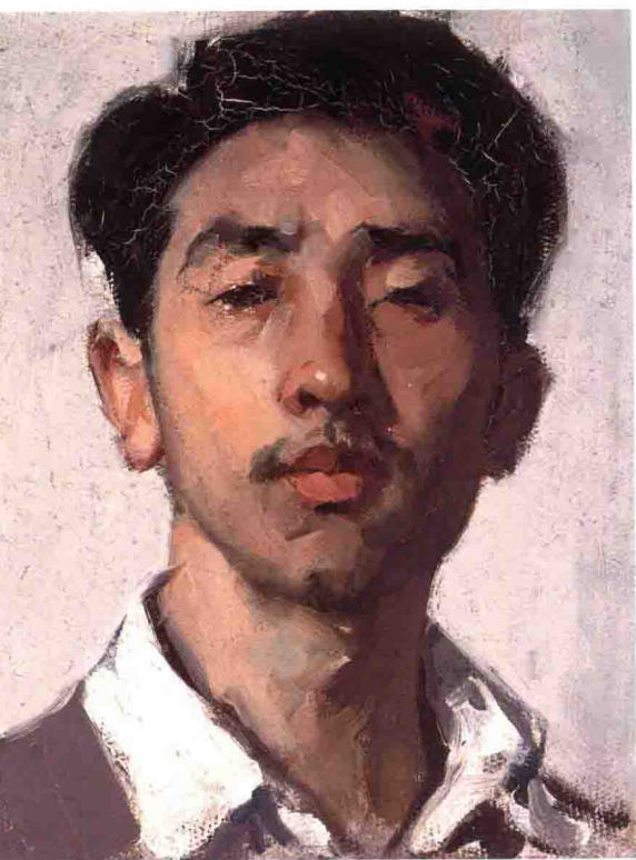
《自画像》 纸 板油画 100cm × 22.3cm 1959年