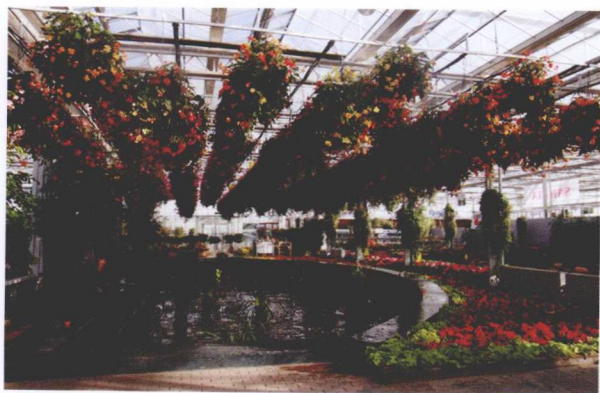
现代化的生态花园

的农业区域,在实现高科技、高效益、集约化、市场化的现代经营活动的同时,美化景观,保护环境,提供观光旅游并可持续发展的新型农业,