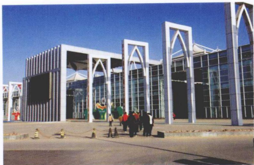
农业大观园(宁夏农业博览园)

产技术的支持下,其土地利用模式则以立体结构为主,这可以极大地提高土地生产效益,并可使农业生产突破传统方式受制于土地自然供给的局限,开发土地经济供给的无限性。