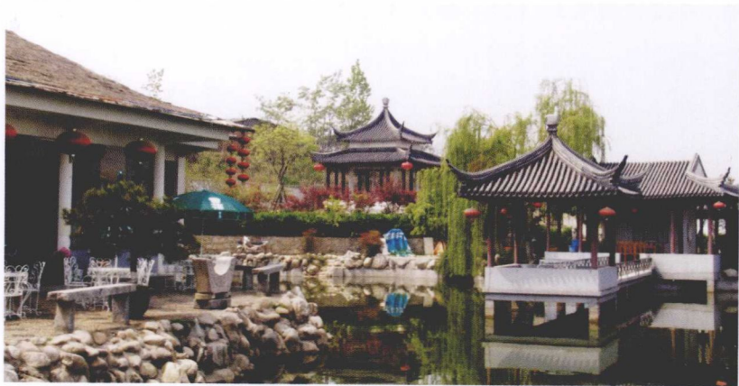
优雅的休闲度假村