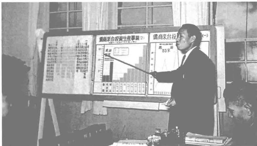
何公於僑委會服務期間，對華僑經濟問題常提出精闢的見解與看法。攝於民國四十五年元月。