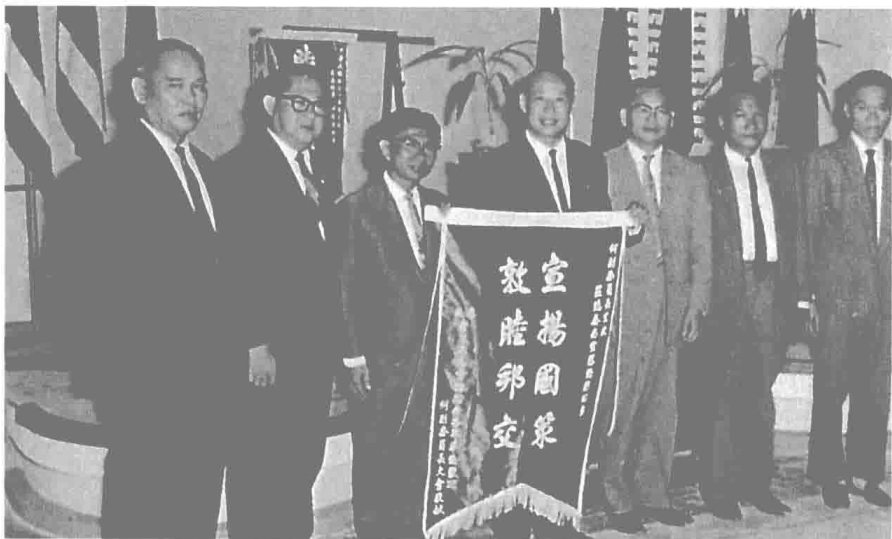
民國五十五年赴泰國宣慰華僑。