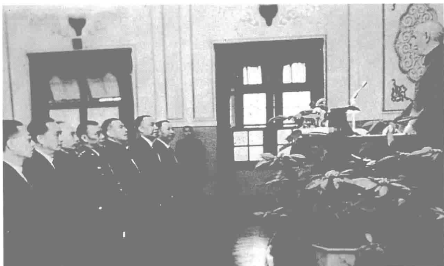
民國五十一年底，何公宣誓就任僑務委員會副委員長，由總統蔣中正監誓並致訓詞。