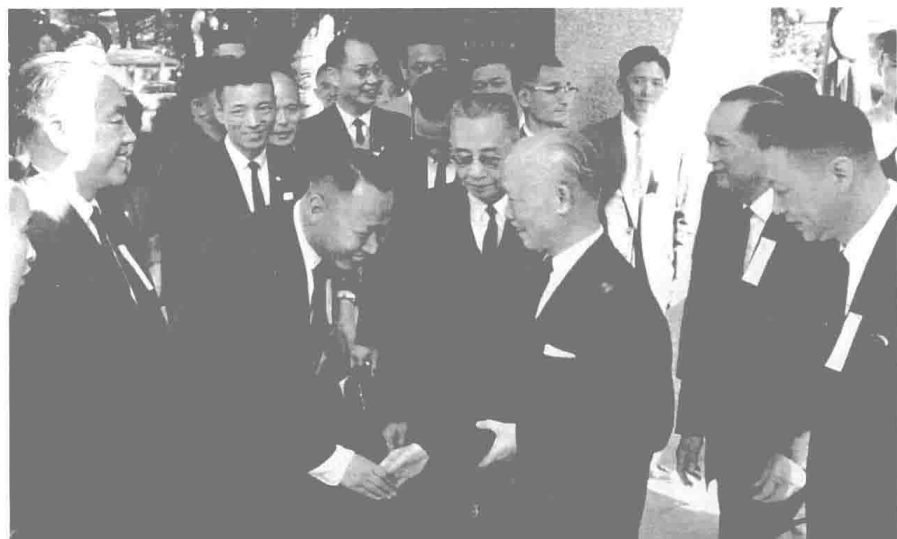
民國五十一年底，何公與僑務委員會高信委員長（右二）、袁觀賢副委員長（左一）拜見陳誠副總統。右一為國民黨中央委員會第三組馬樹禮主任。中為行政院祕書長陳雪屏。