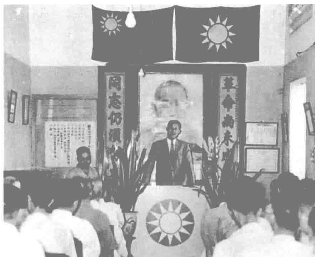
民國四十二年，何公赴緬甸宣慰僑胞、視導僑務。