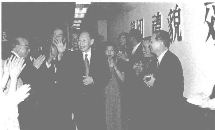
民國八十九年十月何公於世華銀行董事長任內退休，前後服務世華達二十八年，於榮退歡送茶會上，何公揮手向同仁致意。