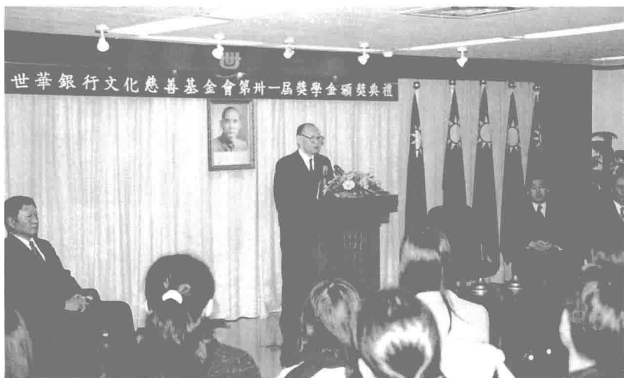
世華銀行於民國六十九年成立文化慈善基金會，每年均頒發獎學金鼓勵優秀清寒的大學青年進德修業。