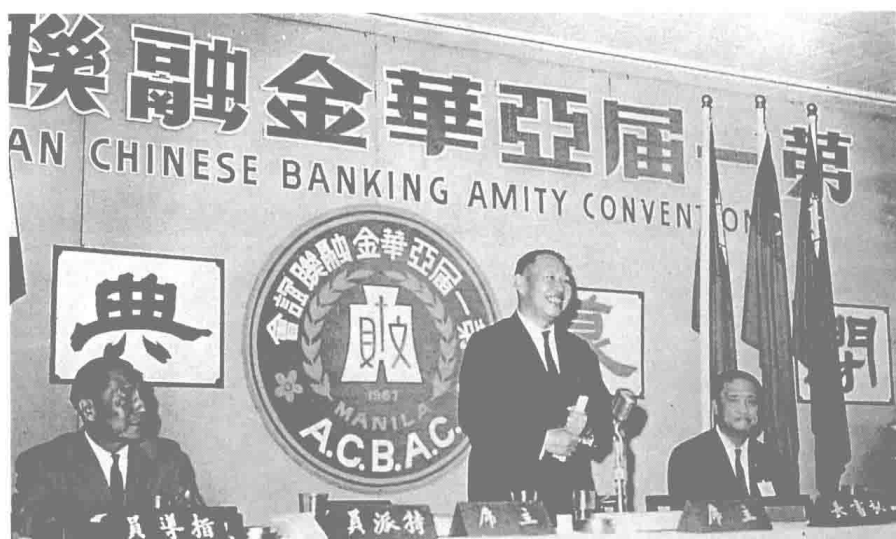
在何公的規劃下，民國五十六年七月第一屆亞洲華商金融聯誼會議在菲律賓首都馬尼拉舉行，何公以特派員身分列席指導。