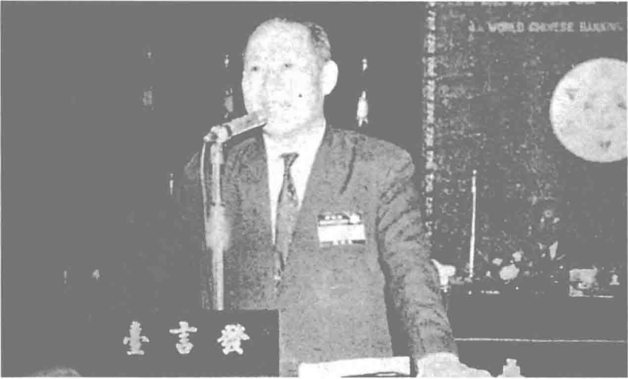
民國六十年九月十六日，第四屆世華金融聯誼會在台北舉行。世華銀行之誕生源起於此次會議的決定。