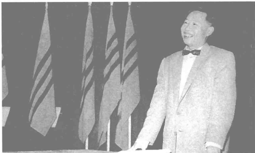
民國四十六年何公赴越南宣慰僑社。