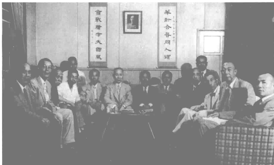
民國四十四年，何公於日本橫濱與華商貿易公會人員合影，中右為何公。