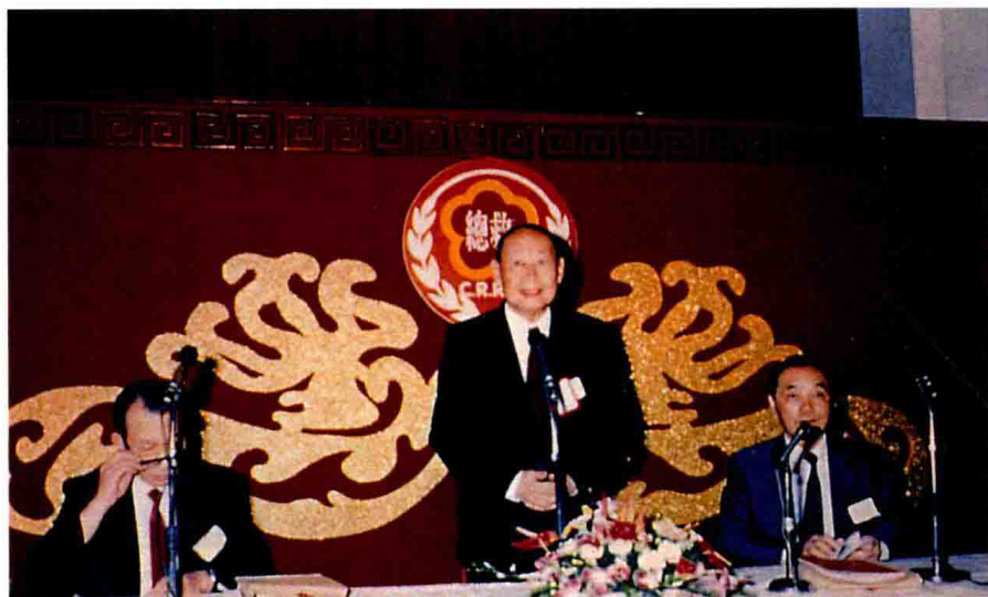
何公參與大陸災胞救濟總會活動長達五十載，支持救總的各項活動可謂不遺餘力。