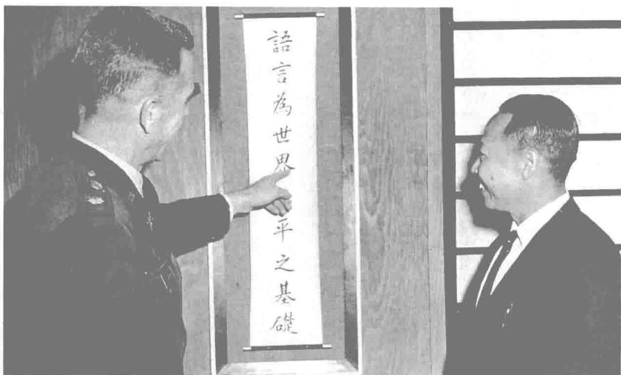
民國五十年，何公赴美華盛頓州立大學進修，順道訪問加州蒙特利美國陸軍語文學校，瞭解該校三個月中文講寫密集訓練班，以助海外中文之僑教。