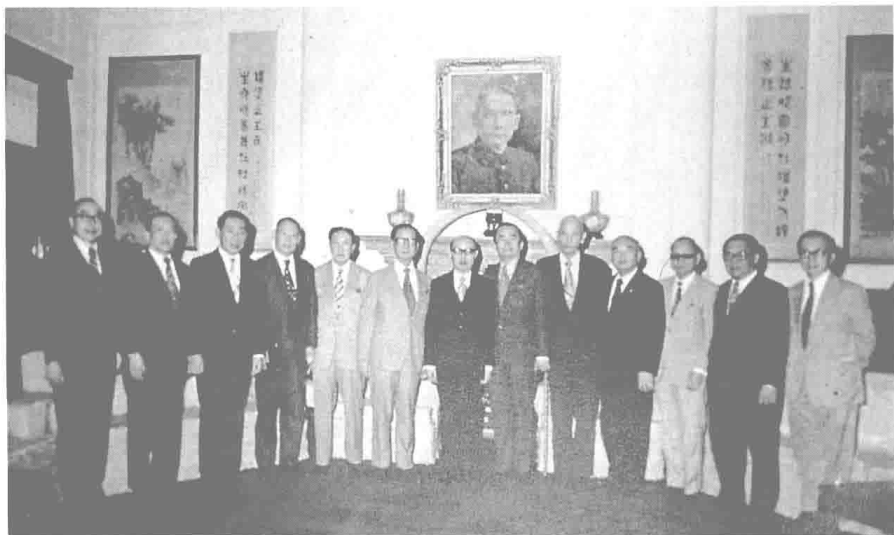
民國六十五年五月，何公（左四）率世華銀行海外董事晉見總統嚴家淦先生（中）。