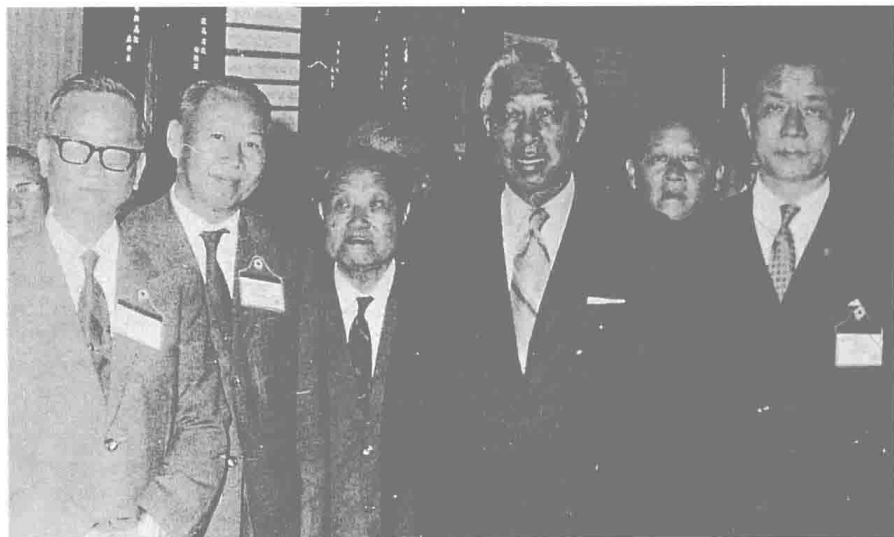
何公（左二）與高信委員長（左一）共事十年，深受高委員長信任。右起：經濟部長孫運璿、美國參議員鄺友良。（攝於民國五十八年底）