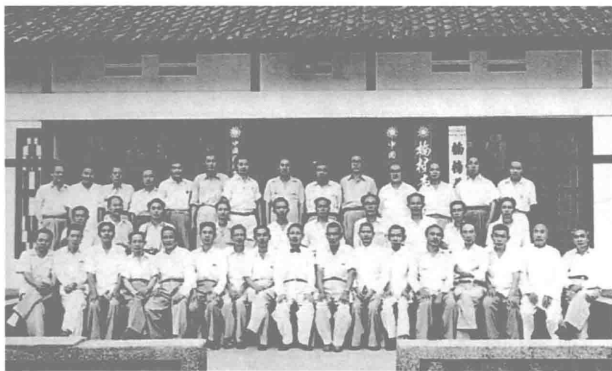
民國四十二年，何公（中間領帶者）奉派印尼視導僑務，足跡遍歷印尼全國各地。