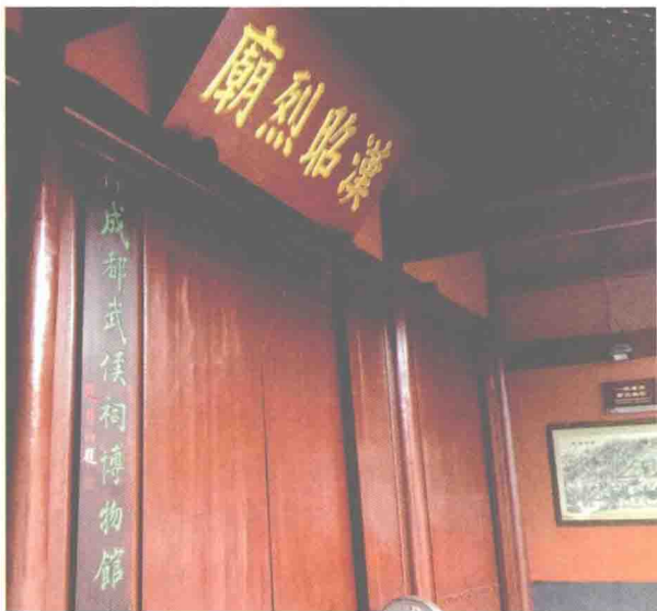
图1：成都武侯祠正门

再到后来，纪念诸葛亮的武侯祠，不仅与祭祀刘备的汉昭烈庙合而为一，而且在成都民众的口中，“武侯祠”的名字还逐渐掩盖了“汉昭烈庙”的原始名称。民国年间的革命家、教育家和大学者邹鲁，为此专门写了一首七言诗：“门额大书昭烈庙，世人都道武侯祠。由来名位输功业，丞相功高百代思。”邹鲁先生认为，武侯祠这种称呼的广泛流行，完全反映出成都广大民众的心声，而这种现象的出现，是因为诸葛亮的“功业”得到了广大民众由衷的认同。他的看法当然是正确的。只是还可以补充的是，此处的“功业”，不单单在于诸葛亮生前建立的功劳和业绩，比如南征、北伐之类，更在于他去世之后的上千年间，在人生教育方面，一直不断传达出潜移默化的正能量。