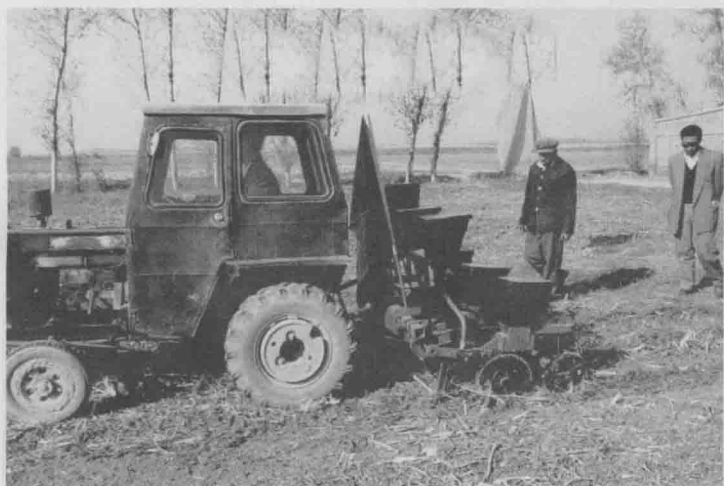
贴茬播种机厂产品试播