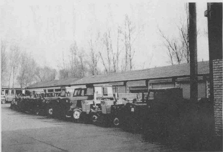
李郁庄农机站的农机设备