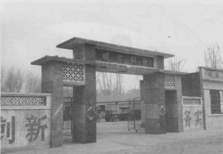
定兴县李郁庄乡农机站