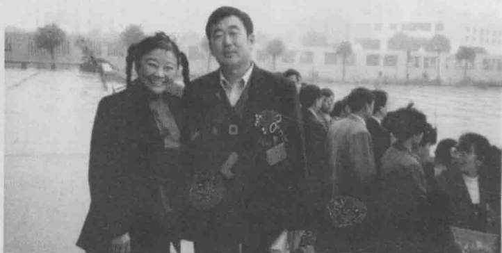
在“如心农业奖励金”颁奖会上刘进禄和香港华懋集团主席 龚如心女士合影