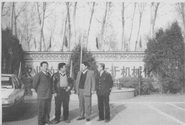
县农业局领导来农机站指导工作