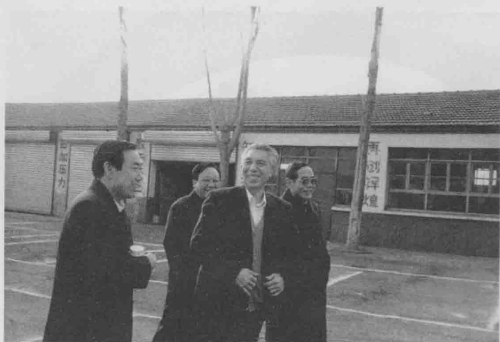
保定市副市长杨廷顺在定兴县委书记金殿元（左二）、县长郑开军（左一）、县人大主任杨玉海陪同下视察李郁庄农机站