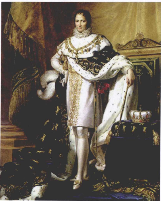
◎ 西班牙国王约瑟夫·波拿巴

半岛战争在拿破仑时代军事历史研究中，同法俄战争和滑铁卢战役相比，显得有些冷门，毕竟拿破仑只参加了其中一小部分