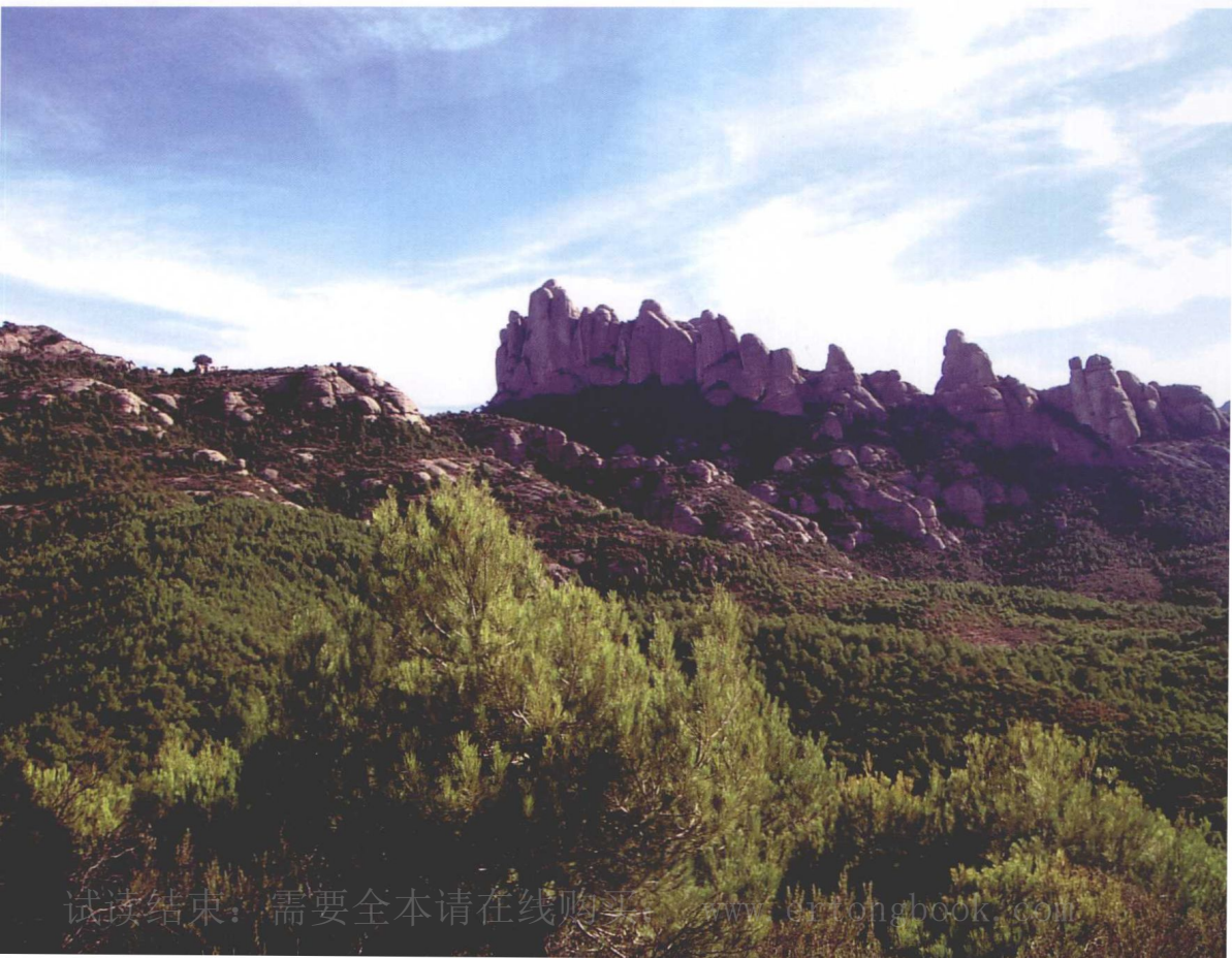
◎ 布鲁克附近险峻的山口