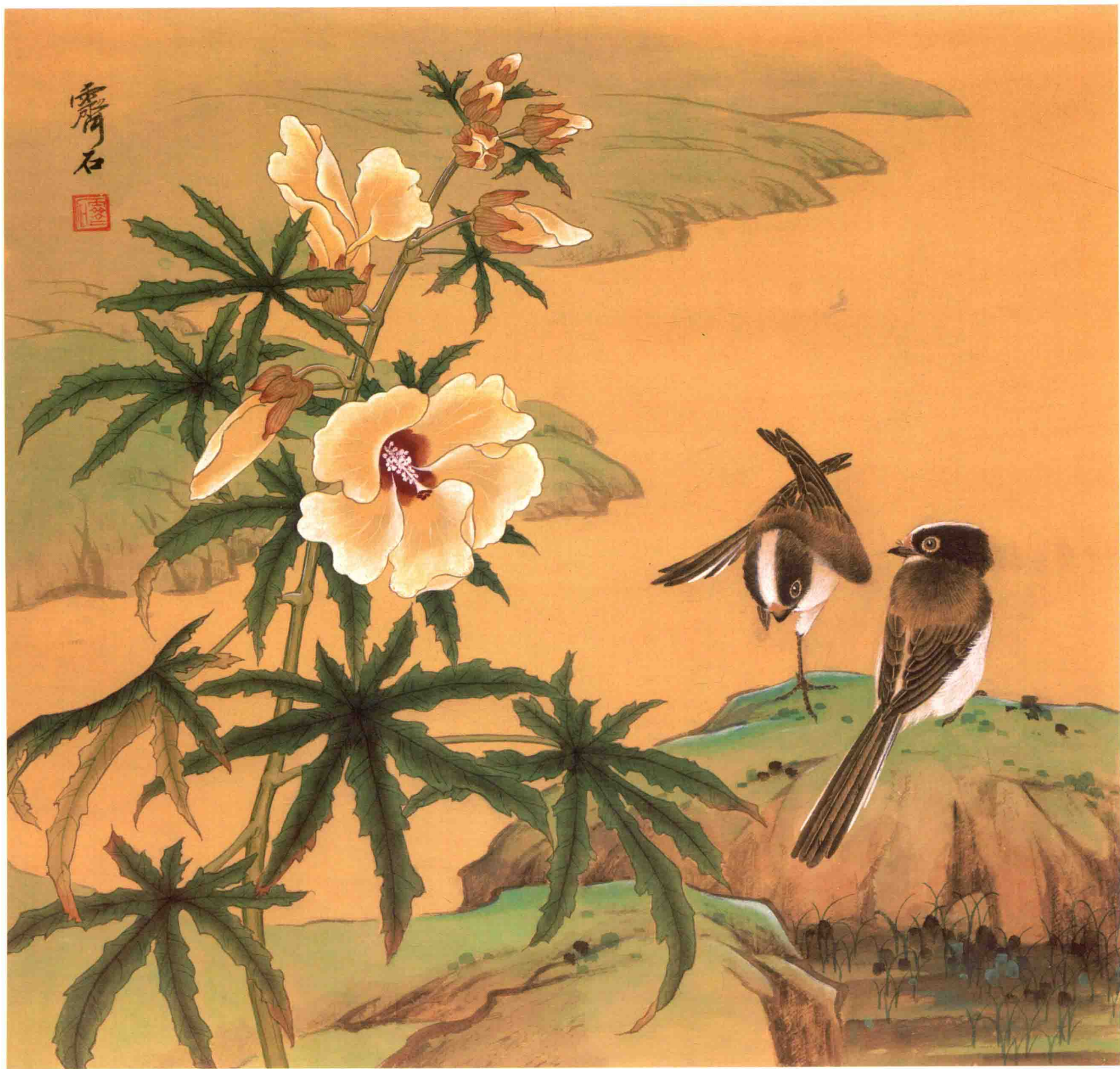
银喉长尾山雀 秋葵