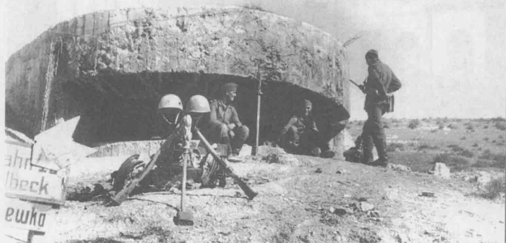
上图：1941年，乌克兰境内，一群德军士兵在一座刚刚被攻占的苏军碉堡外面休息，这里曾是1939年之前苏联境内修建的一条防线的一部分。