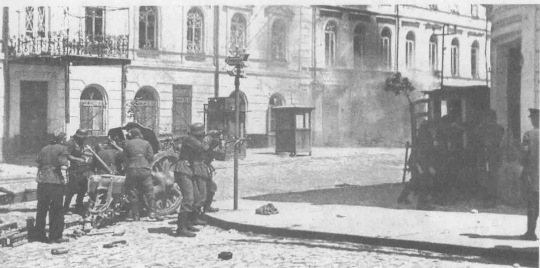
上图：德军部队在基辅街头战斗。在战争初期，遭到突然袭击的苏联红军对于不断推进的德国国防军几乎束手无策，只得任由他们横扫和肆虐乌克兰和俄罗斯西部的一些古老城市。

战经验的德军部队巧妙地将88毫米高射炮用作反坦克火炮，挫败了苏军的进攻势头。苏军第5集团军再次退入沼泽地带。在随后的6个星期内，这种局面使得克莱斯特和赖歇瑙始终觉得如鲠在喉、如芒在背。