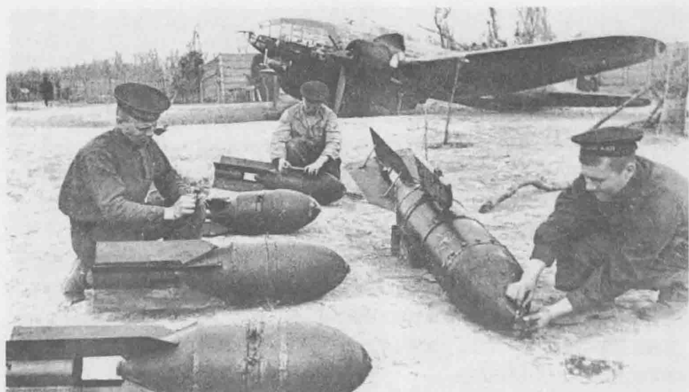
上图：1941年，克里米亚一处飞机场内，在一架“伊尔”DB-3BF型远程轰炸机执行任务前，苏联空军军械士正在给重达250千克的炸弹安装引信。

斯克要塞，而后直逼白俄罗斯首府明斯克。届时，他将从南翼进攻这座城市，与从北翼发起进攻的霍斯的部队会合，形成合围夹击之势。通过这种方式，将把苏军部队分割包围在一个巨大的“锅炉”内，一旦苏军的补给消耗干净，除了投降之外他们将别无他法。