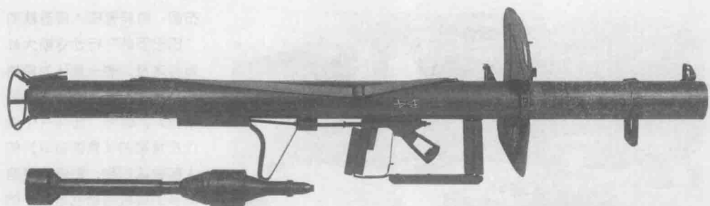
上图：德军的重型反坦克火箭筒。