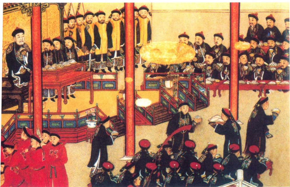
清宫紫光阁赐宴图