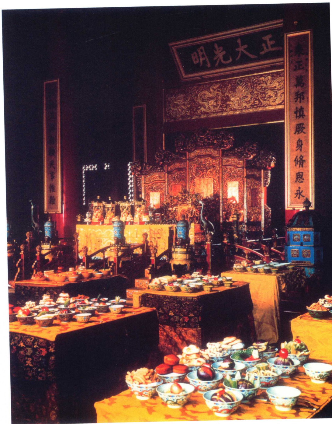
清代北京乾清宫宝座台皇帝宴桌