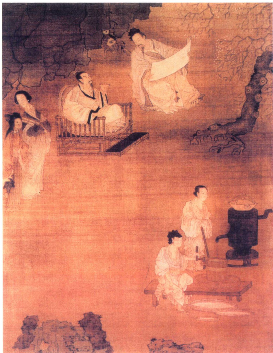
明代崔子忠《杏园宴集图》