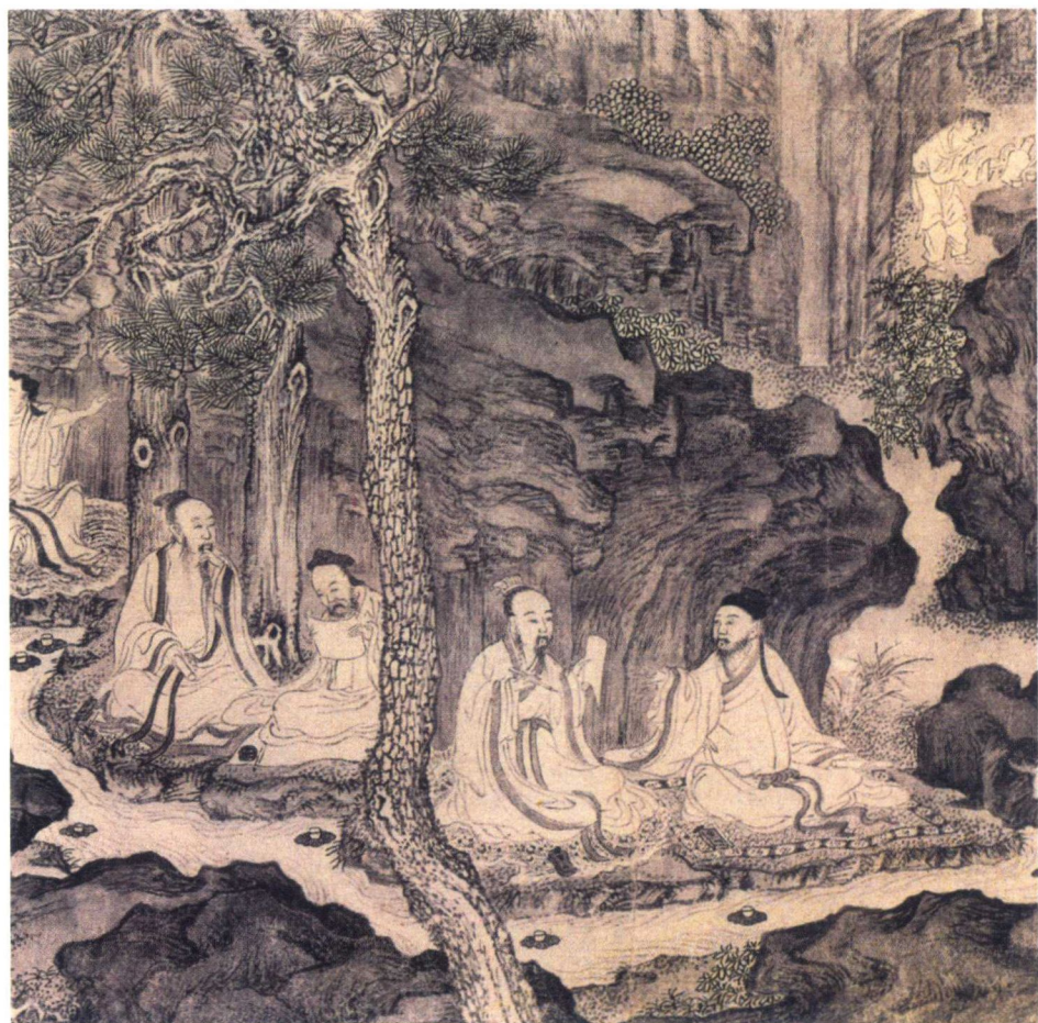
明代黄震《曲水流觞图》