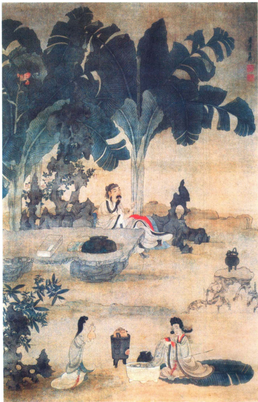
明代陈洪绶《蕉林酌酒图》