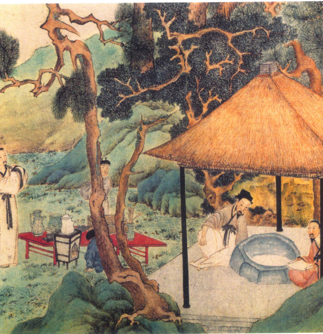
明代文徵明《惠山茶会图》