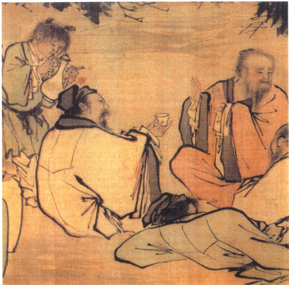
明代万邦治《醉饮图》