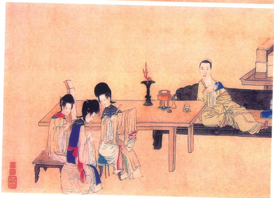
明代禹之鼎《女乐图》中的饮食场面