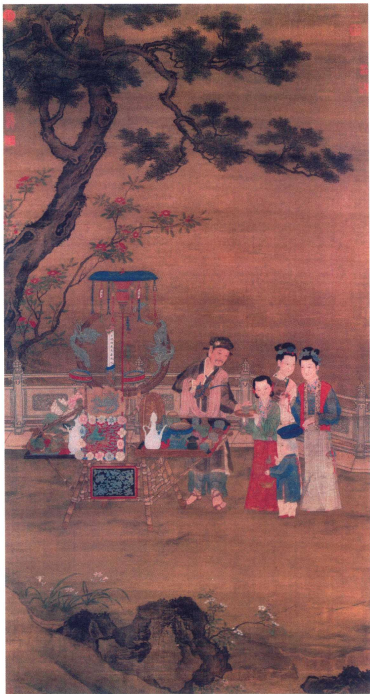
明代佚名《夏景货郎图》中的饮食器具