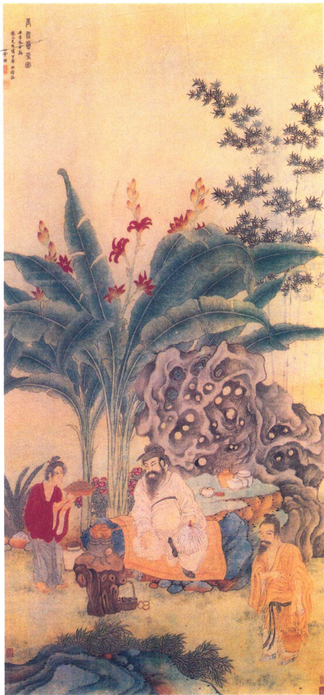
明代丁云鹏《玉川煮茶图》