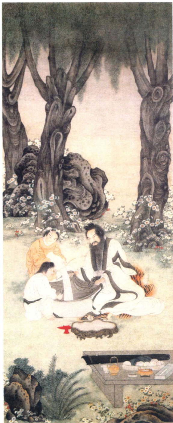
明代丁云鹏《漉酒图》