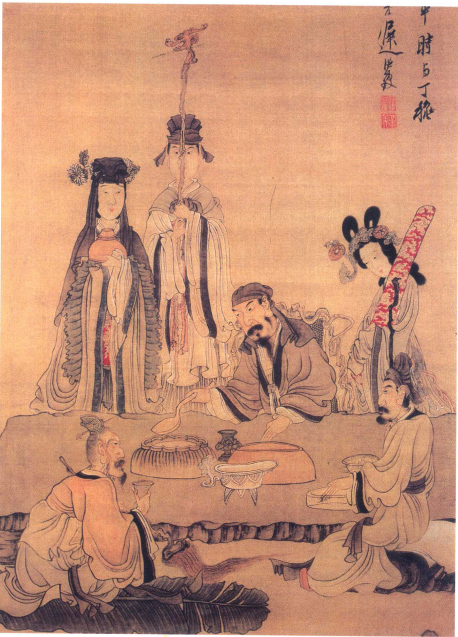
明代陈洪绶《饮酒祝寿图》