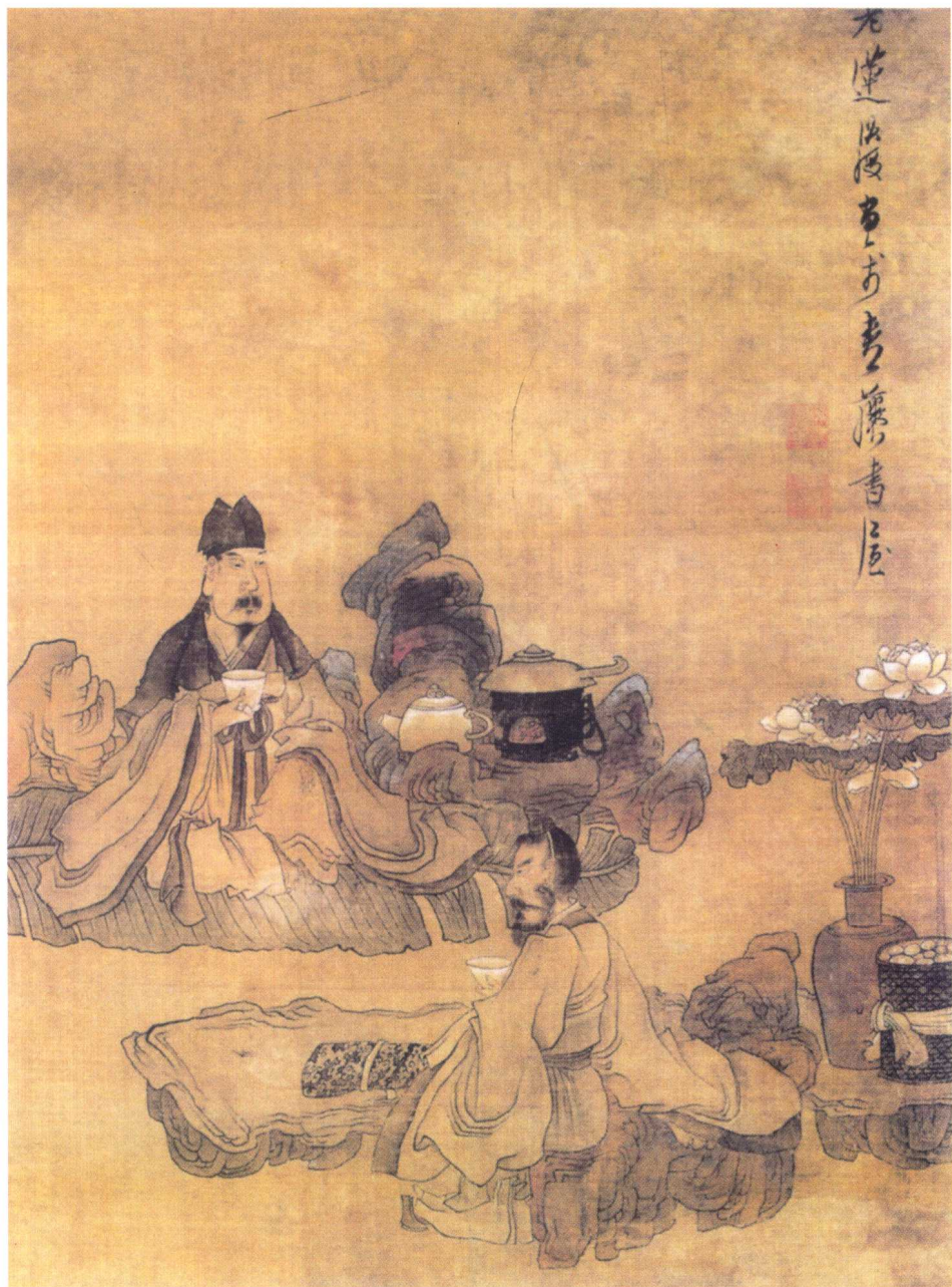
明代陈洪绶《停琴品茗图》