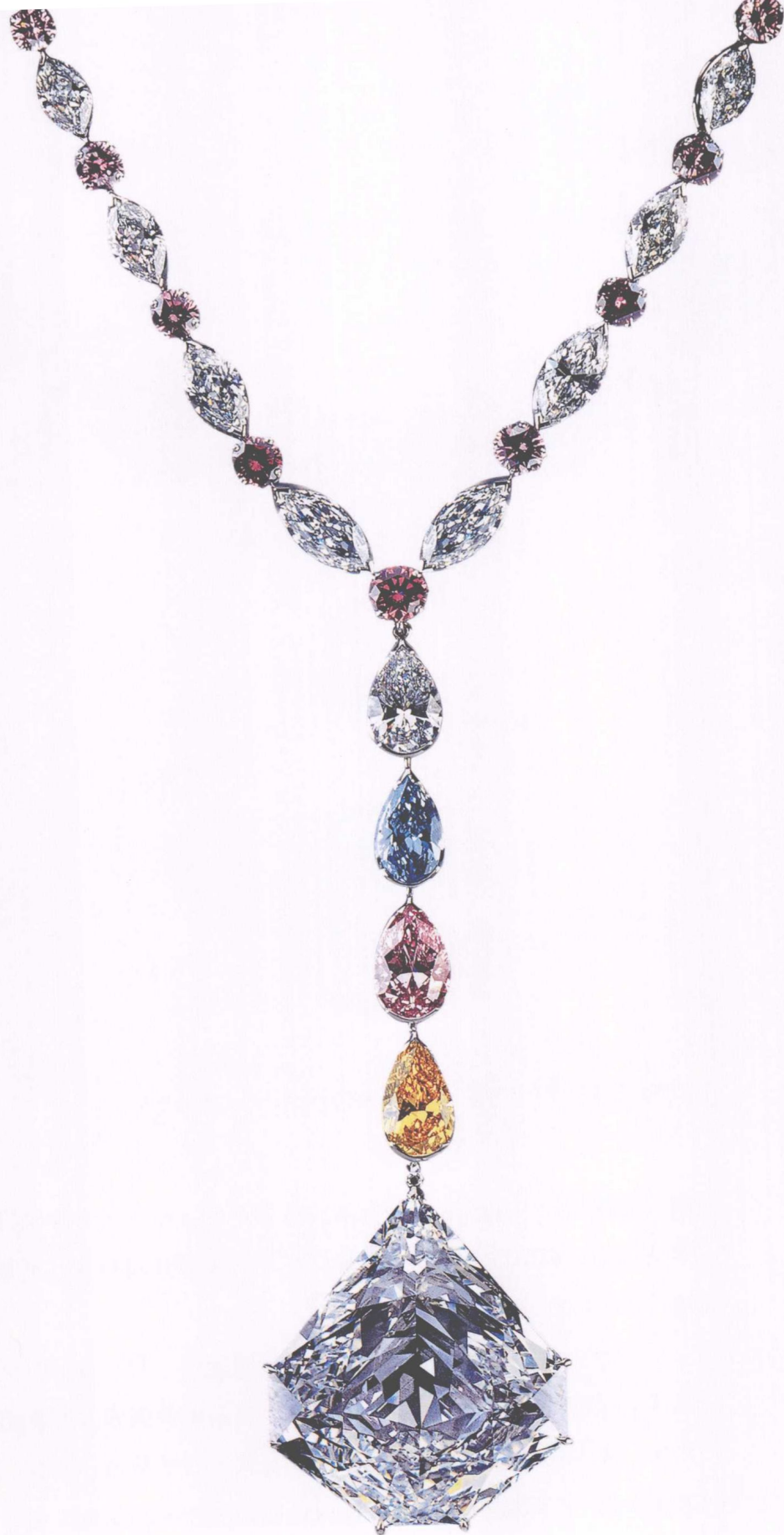
137.82 克拉的千禧项链，钻石火彩瞩目，质地洁净，难得一见的珍品