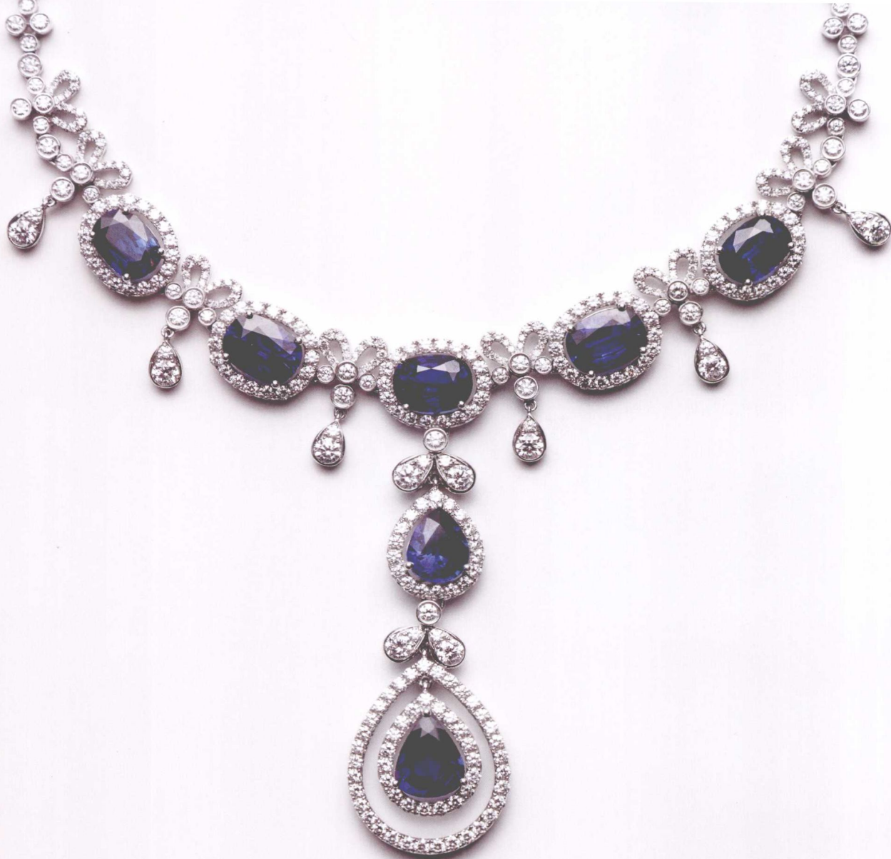
顶级蓝宝石项链，颗颗蓝宝石质地纯净，设计大气，彰显华贵

丽、晶莹剔透、坚硬持久的性质，价值不菲，而且所有珠宝都是千万年的产物，亲历过无数雨雪风霜，见证过无数日出日落，汇集了“天地日月之精华”。