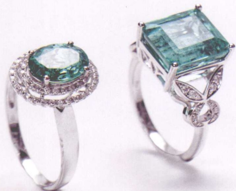
椭圆形和方形绿色宝石戒指，圆形更富女性气质，方形则更显大气

石，为了将金刚石带出矿山，他忍痛割破自己的大腿，将宝石藏在皮肉之中，然后绑上绷带，逃了出去，但是后来在出海的船上，这块宝石被船长夺走，又辗转到了英国总督的手中，经过几次战争后，这块钻石最终流落到了法国，被法国卢浮宫阿波罗艺术馆收藏。这块特大型金刚石也就是现在世界著名巨钻——“摄政王”。