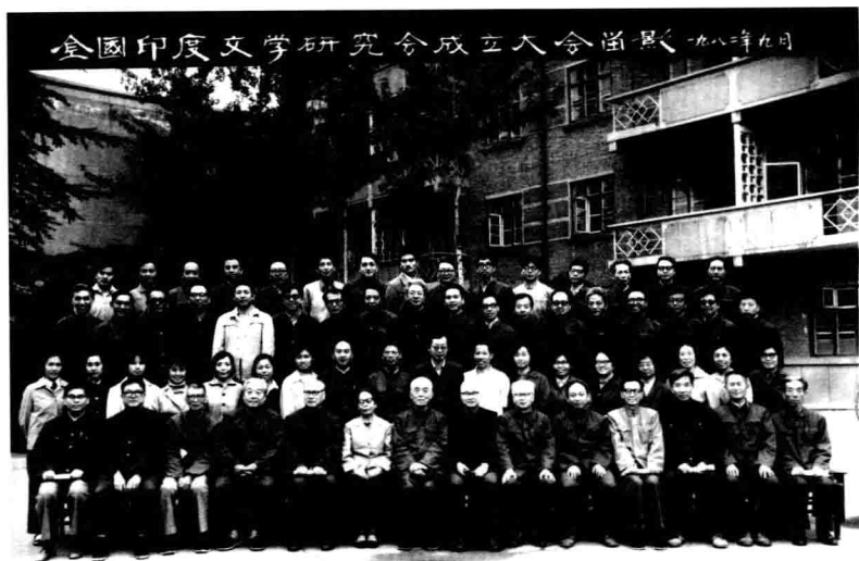
1982年9月，全國印度文學研究會成立大會留影