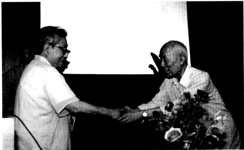
1991年8月，在北京大学东方语系等单位举办的“庆祝季羨林教授八十华诞”祝寿会上，冯至教授同作者握手祝贺