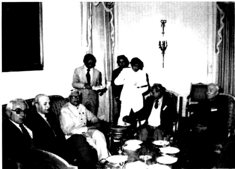
1985年3月参加印度召开的“印度与世界文学国际讨论会”期间，与印度副总统合影