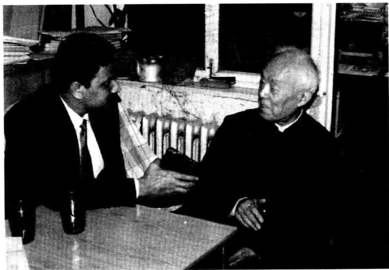
在家中會見印度朋友