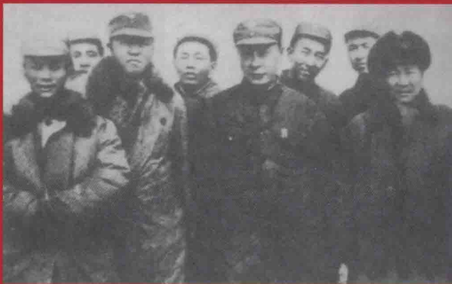
1945 年，陈毅与张云逸、张鼎丞等在津浦战役前线。