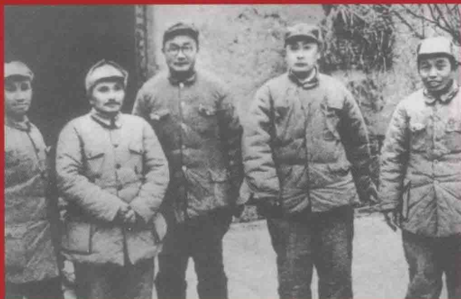
1948年底，邓小平同淮海战役总前委领导成员合影。左起粟裕、邓小平、刘伯承、陈毅、谭震林。

谭震林是党的七届、八届、十届、十一届中央委员会。在党的十二次全国代表大会上，当选为中央顾问委员会委员，并在中顾委第一次全体会议上被选为中顾委副主任。1983年9月30日在北京病逝。