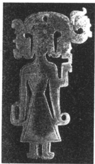
商·龙凤冠人形玉佩。青黄色，体扁平，正面微鼓，背面微凹，面部五官由阴线刻出，细颈，身着束腰连衣裙，两脚外撇，脚跟相连，两长袖下垂，袖口上卷。头顶钻一圆孔，以便佩带。是商代贵族的佩饰。

纣王好酒淫乐，寸步不离妲己，妲己所称赞的就以之为贵，妲己所憎恶的就加以诛灭。纣王又在朝歌与邯郸之间纵横数千里内，每隔五里建一所离宫，每隔十里建一个别馆，与妲