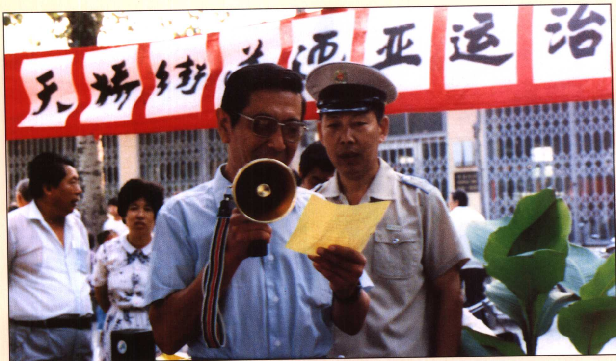
1989年至1990年天桥街道迎亚运市容环境卫生宣传站