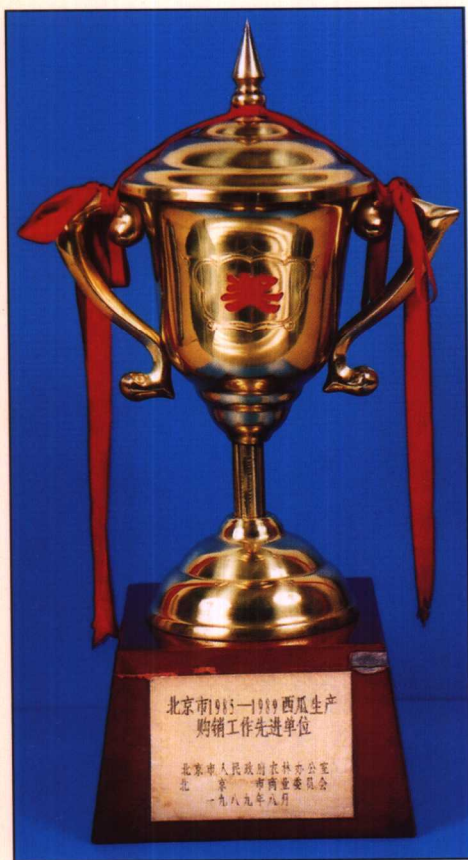
1985年至1989年市政府农林办公室、市商业委员会授予市环境卫生管理局“西瓜生产购销工作先进单位”奖杯