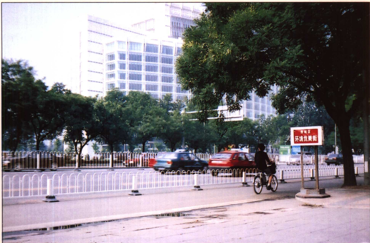
1984年授予复兴门内大街“环境优美街”称号