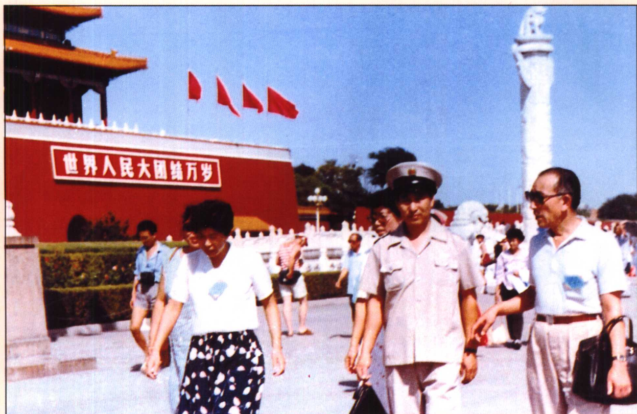
1987年市容监察员会同卫生监督员在重点地区联合执法