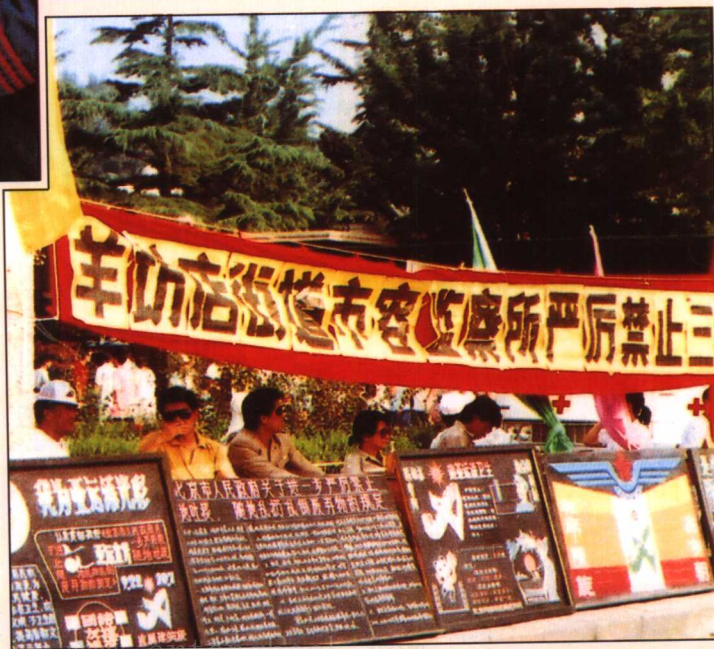
1989年至1990年羊坊店街道市容监察所宣传站