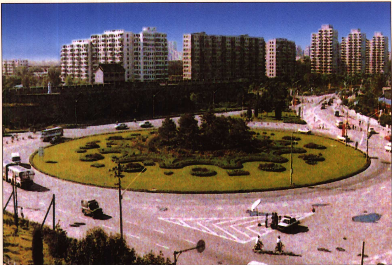
1989年至1990年整治后的西便门环形路