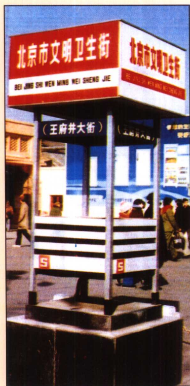
王府井大街“文明卫生街”标志牌