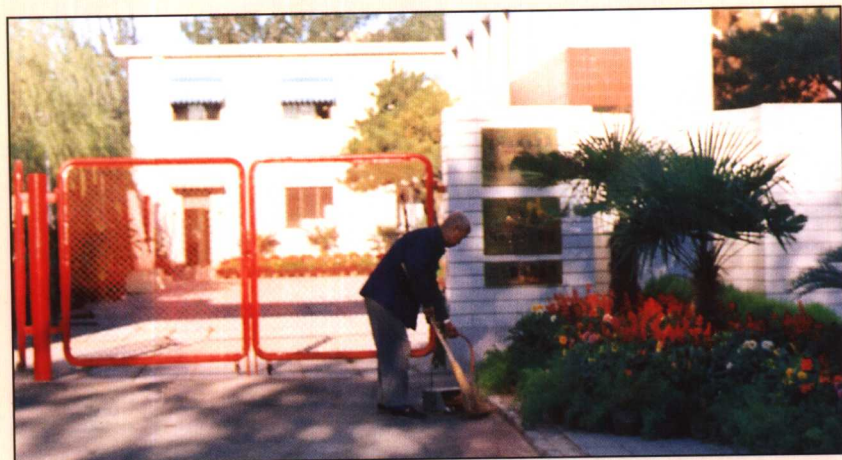
“门前三包”责任人进行门前清扫保洁（1990年摄）