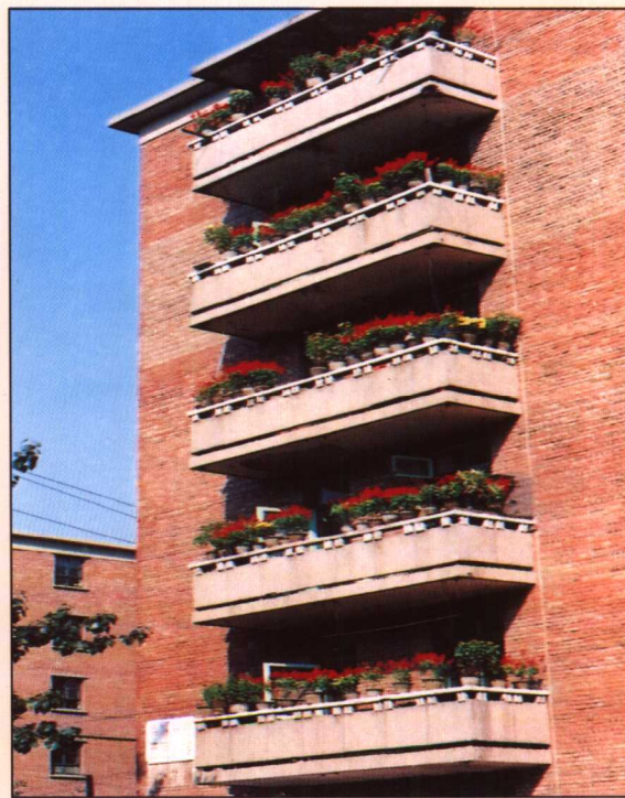
迎“亚运”期间工人体育场北路的阳台整治