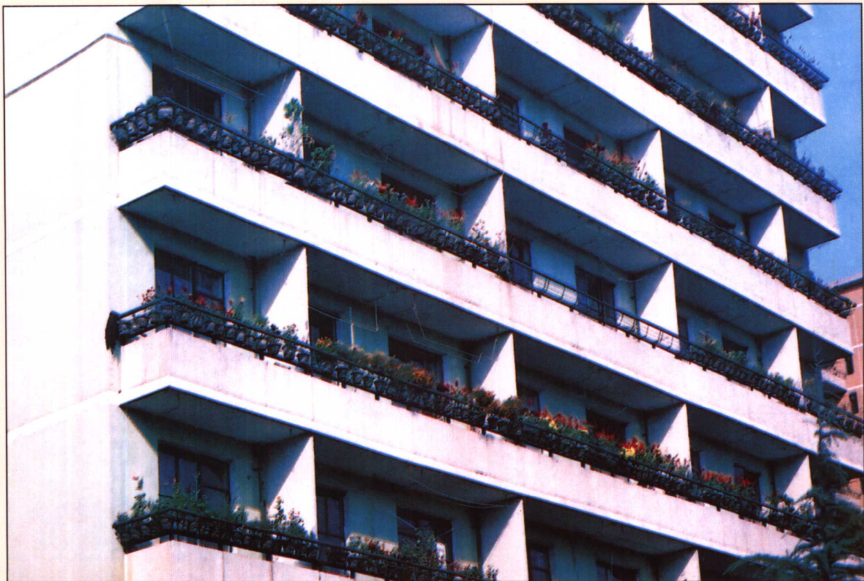
迎“亚运”期间石景山路老山小区的阳台整治