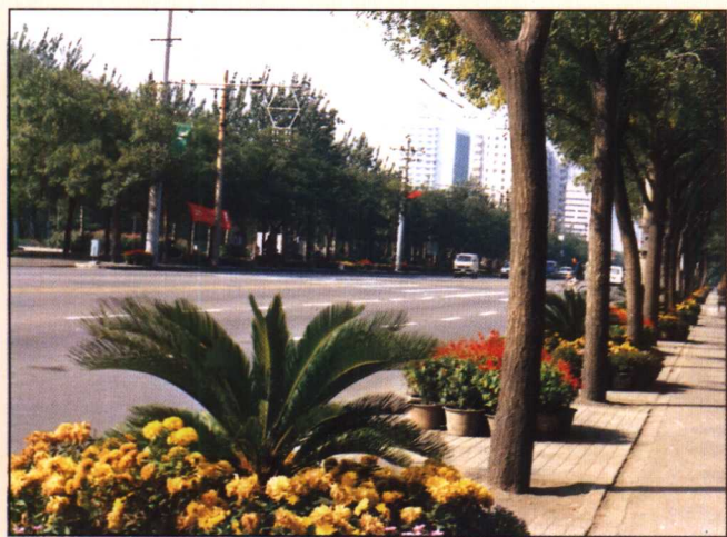
1984年授予工人体育场北路“环境优美街”称号