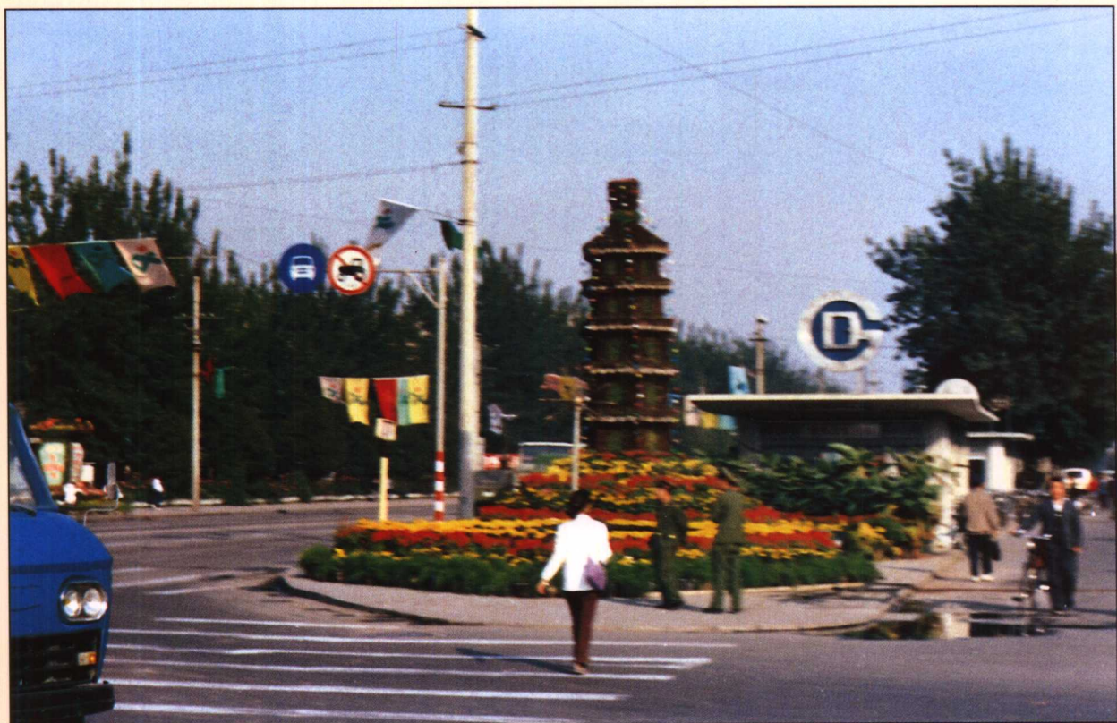
1984年授予复兴路“文明卫生街”称号