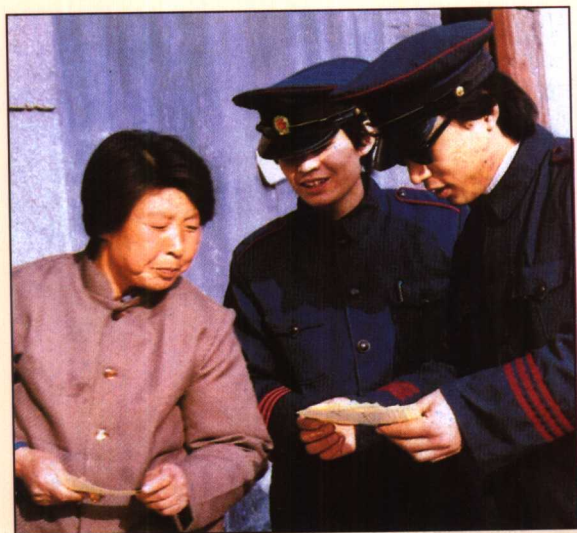
1984年市容监察员向个体工商 户宣传市容环境卫生法规