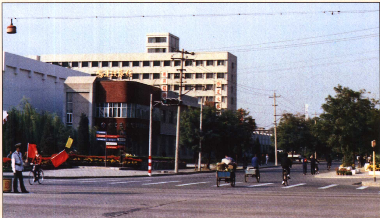
1989年至1990年整治后的玉泉路城乡结合部