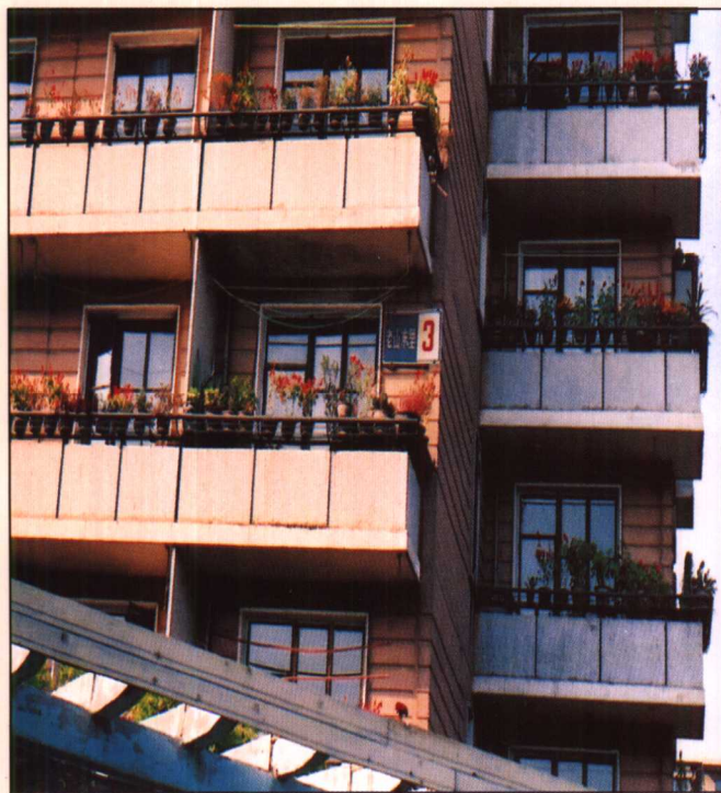
迎“亚运”期间石景山路老山东里小区的阳台整治