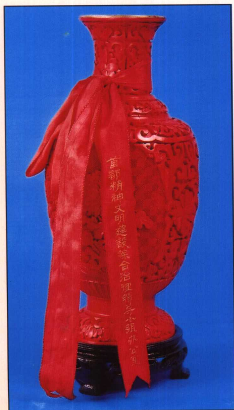
1990年首都精神文明建设综合治理领导小组办公室授予市环境卫生管理局“迎亚运三百天宣传先进单位”奖杯