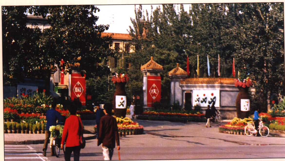
“门前三包”单位门前绿化、美化景观一览（1990年摄）