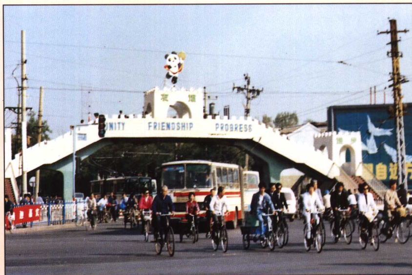
1984年授予东单北大街“文明卫生街”称号