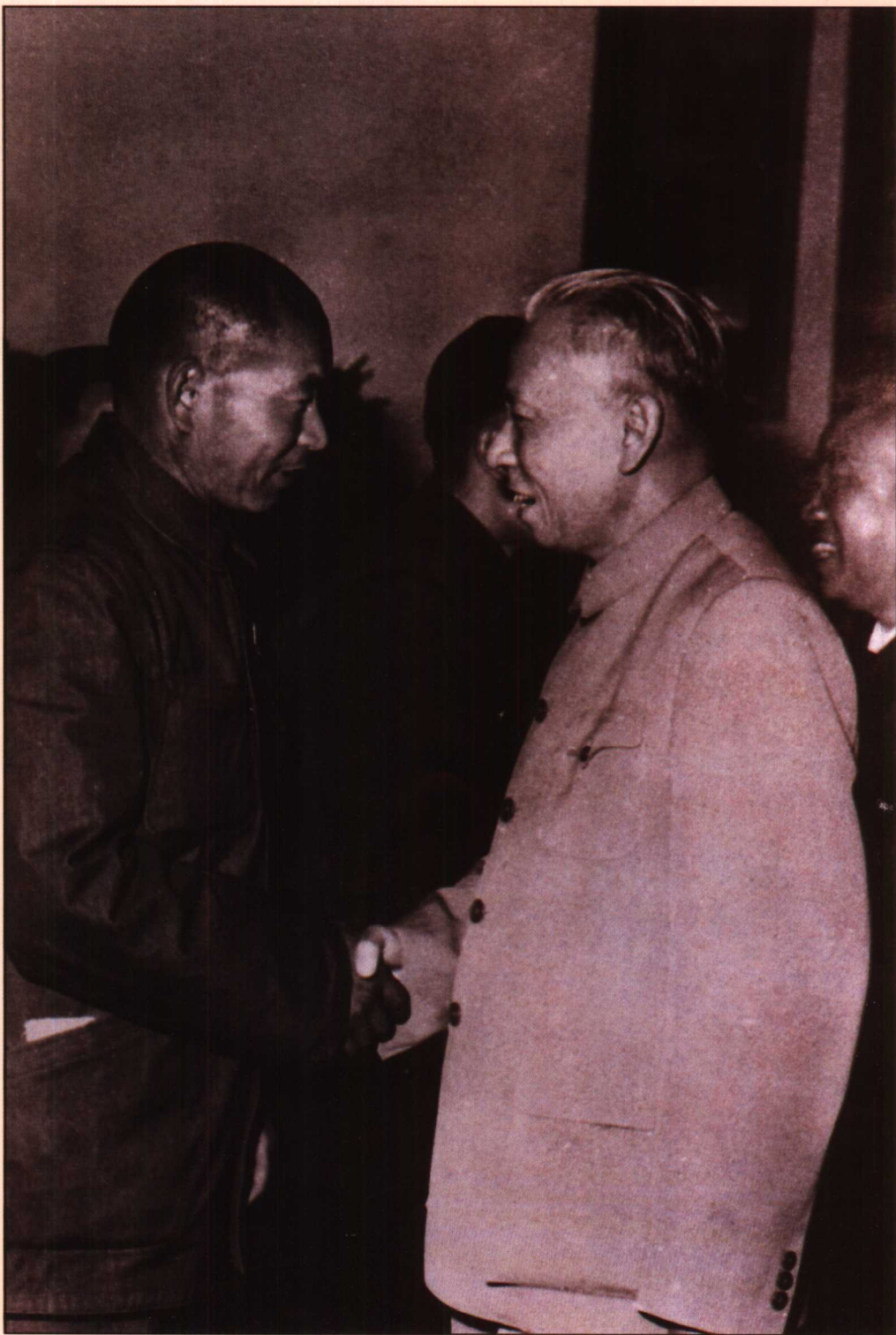
1959年10月26日国家主席刘少奇在全国群英会上接见清洁工人时传祥