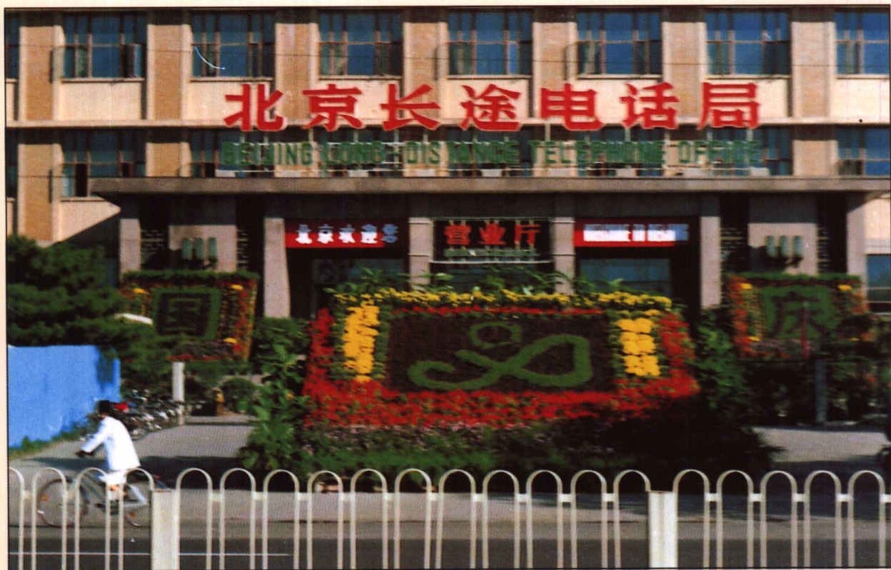
1990年“门前三包”单位以整洁优美的市容环境迎国庆和亚运会