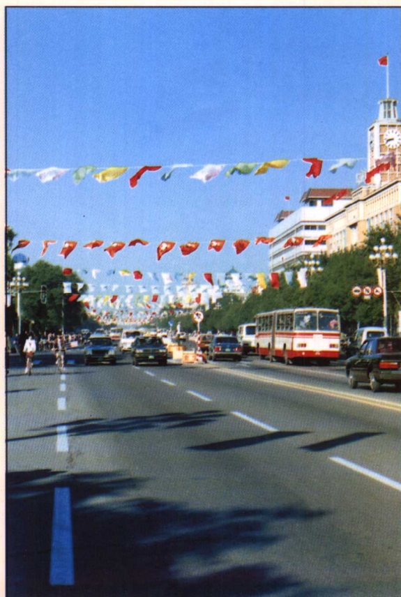
1984年授予西长安街“环境优美街”称号