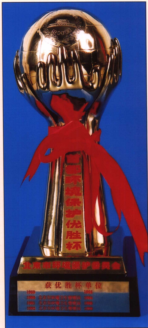
1990年至1992年市环境保护委员会授予市环境卫生管理局“首都环境保护优胜”奖杯