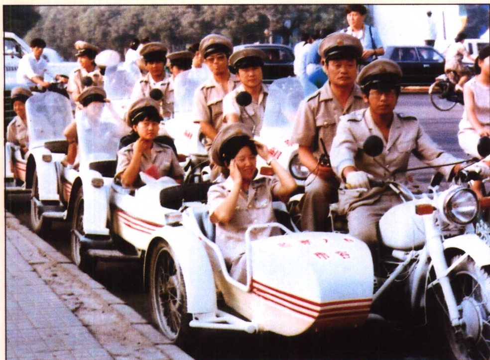
1990年市容监察员在主要街道、重点地区巡回执法