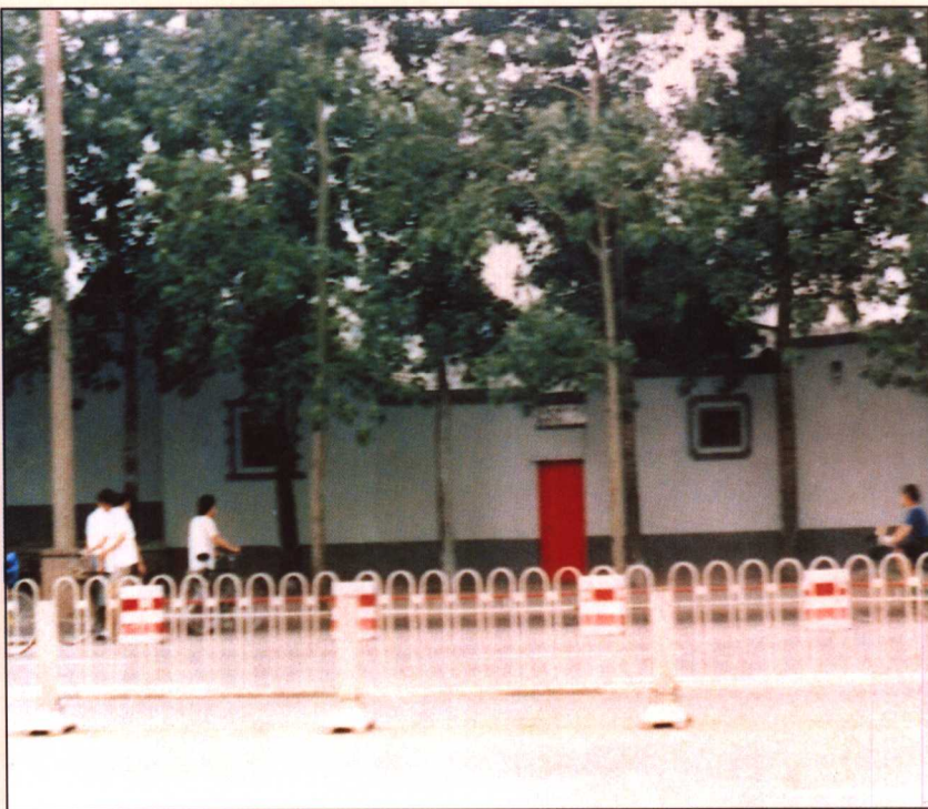
1990年为美化环境在建国门内大街建的遮挡墙