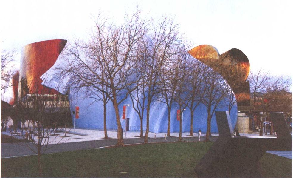
庞大的体量因曲面而不觉压迫，光线变化更增添建筑物的生动活泼个性。