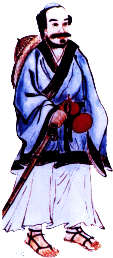
太極拳祖師張三丰像