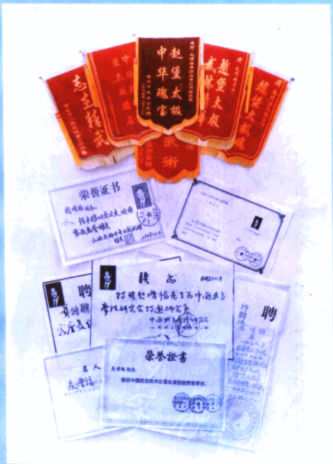
生先福增赵给(發)贈織組關有 件證和書聘、旗錦分部的