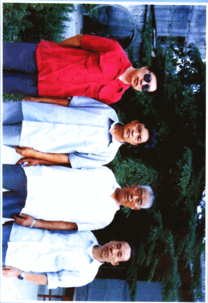
影合月六年五九九一先生民迪路、文學柴、福增趙、超趙：右至左自