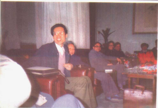
1990年3月26日，共青团中央第一书记宋德福等领导同志与报告团成员座谈。