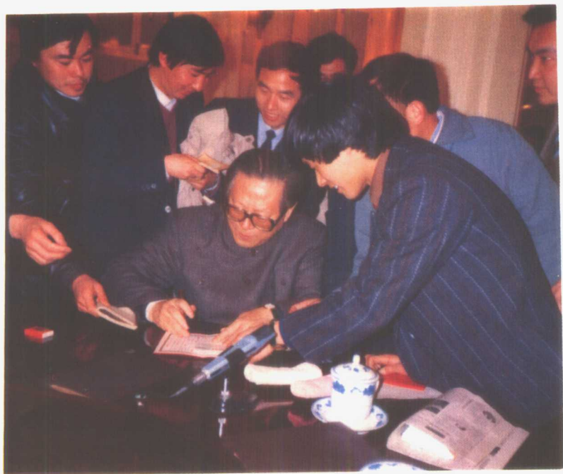
1990年1月1日，中共中央总书记江泽民同志在中南海怀仁堂接见了报告团全体成员后，为他们签名留念。