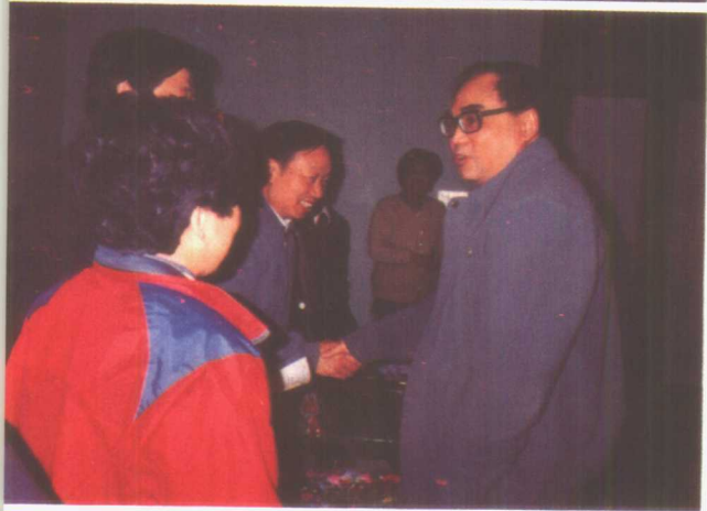
1990年3月26日，中共中央政治局候补委员丁关根接见报告团成员。