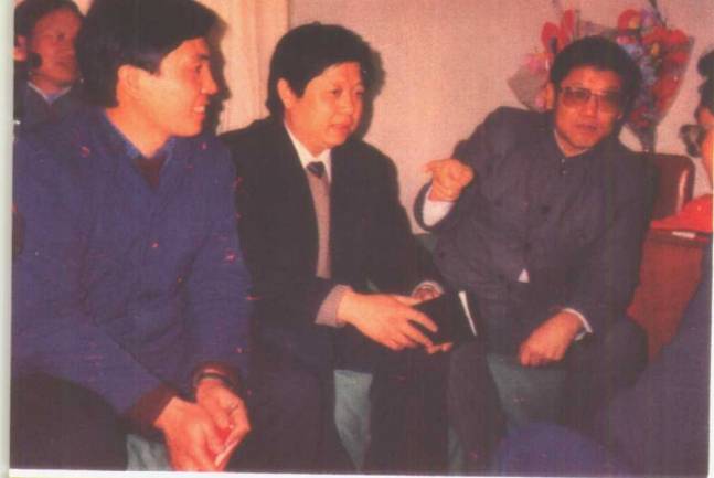
1990年4月4日，中共中央政治局委员李铁映看望报告团成员。