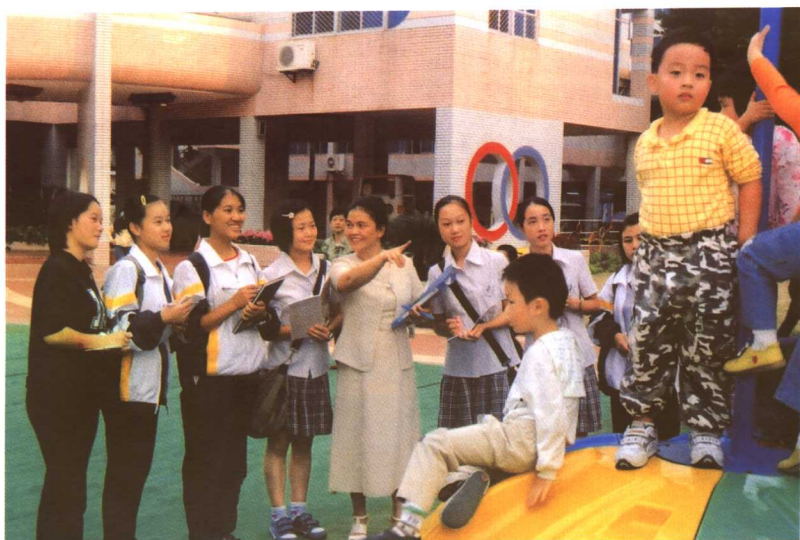
指导学生观察幼儿