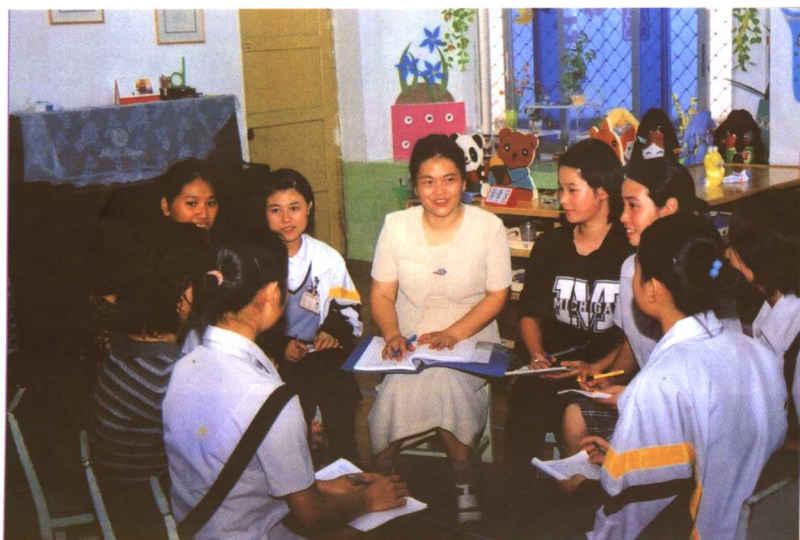
在学生见习后进行讨论分析