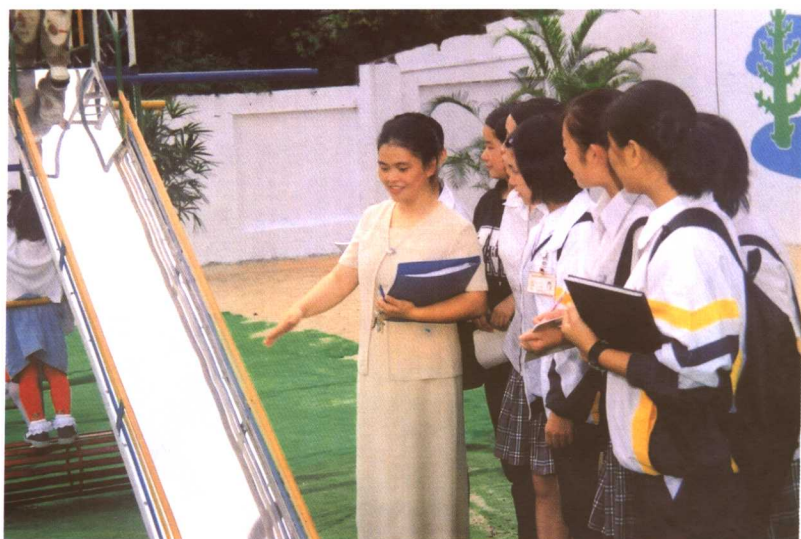
给学生讲解教育技能