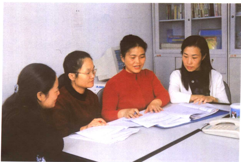
与同事们讨论教科研方案