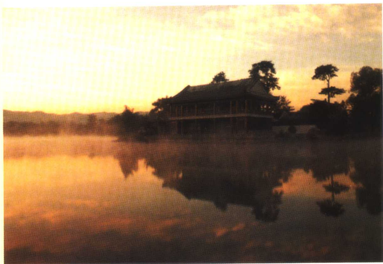
承德避暑山庄烟雨楼（仿嘉兴南湖烟雨楼而建）