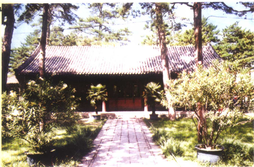
承德避暑山庄“烟波致爽”殿