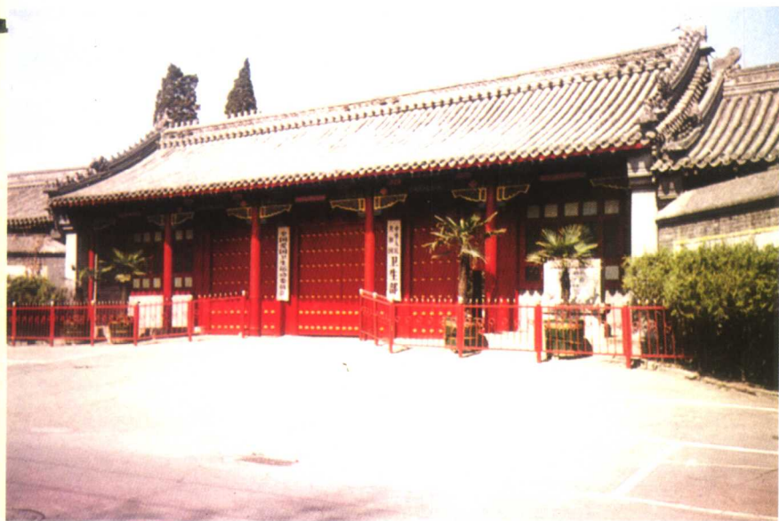
前醇亲王（摄政王）载沣的府第