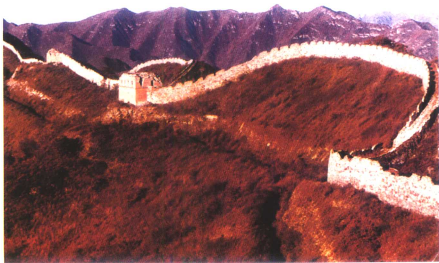
河北怀来县镇边城长城前有拒马沟