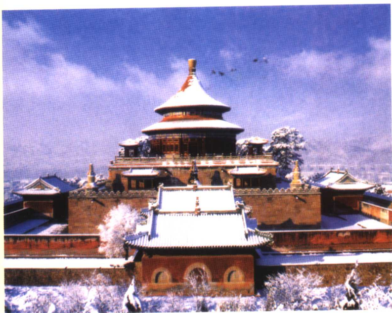
承德避暑山庄普乐寺旭光阁