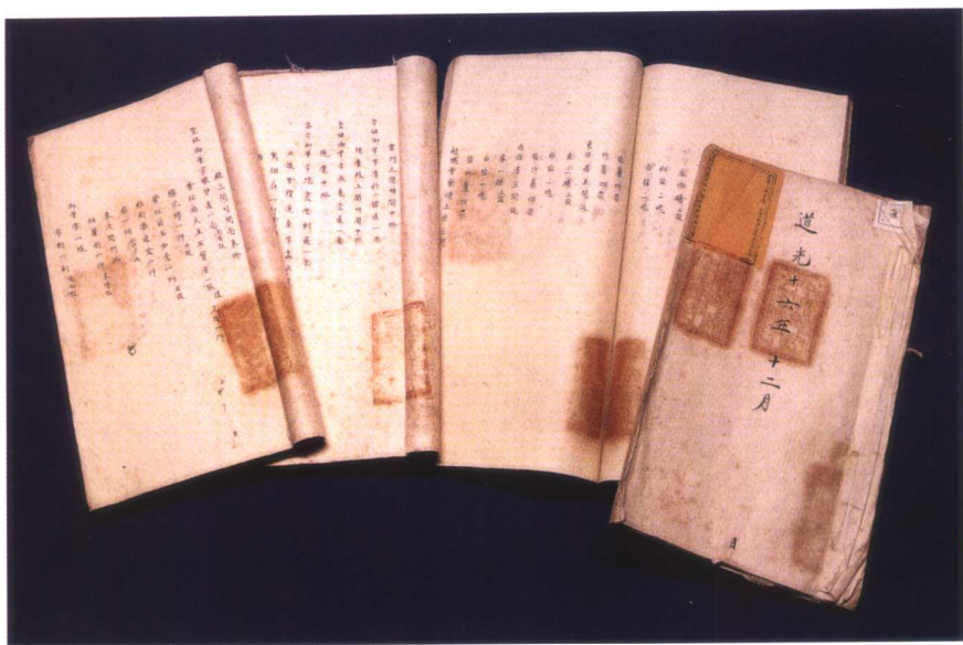
避暑山庄陈设册档案（嘉庆至道光朝）