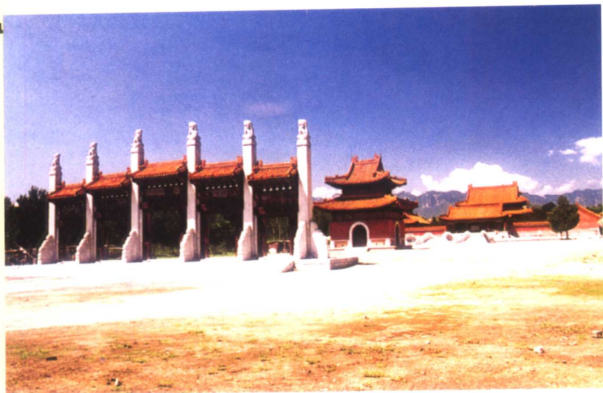
清西陵的崇陵（光绪陵）