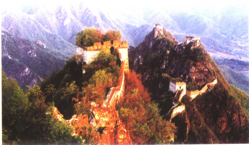
北京怀柔地区涧口长城（明代）