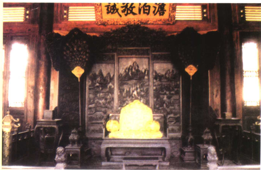
承德避暑山庄澹泊敬诚殿内景