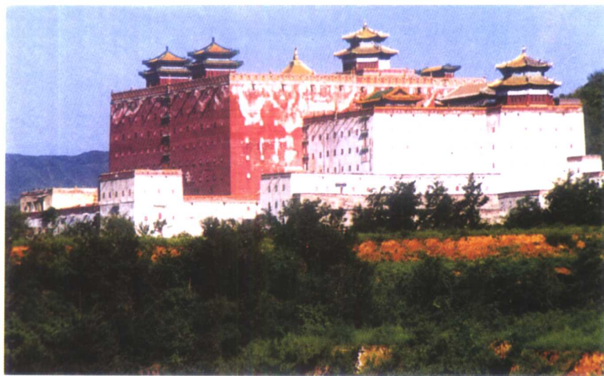
承德须弥福寿之庙（小布达拉宫）远眺