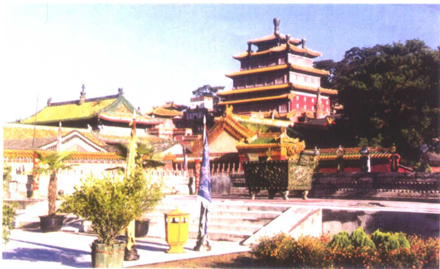
承德普宁寺（俗称大佛寺）大乘阁远眺