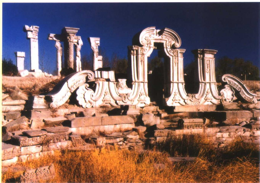
圆明园远瀛观大水法遗迹现状