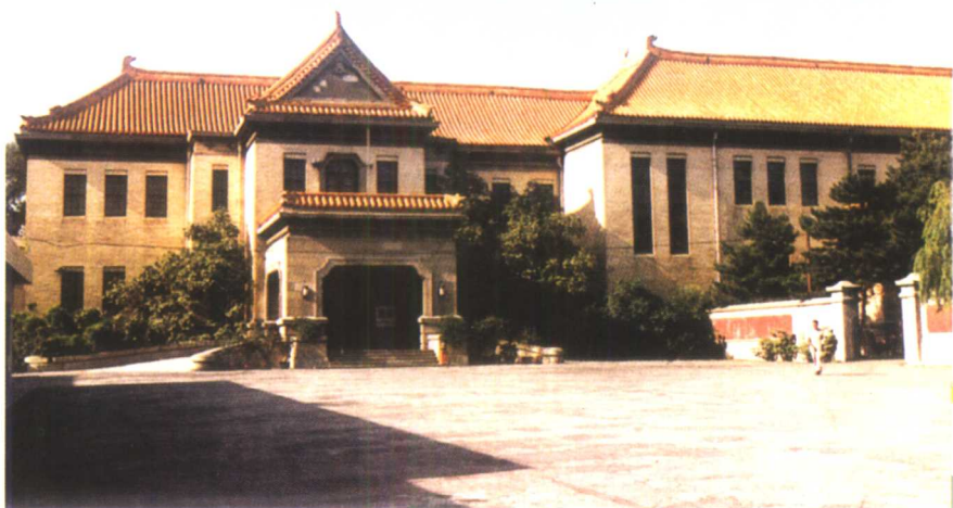
溥仪当伪满皇帝时的长春伪皇宫