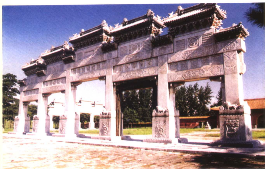
清西陵泰陵（雍正陵）的石牌坊