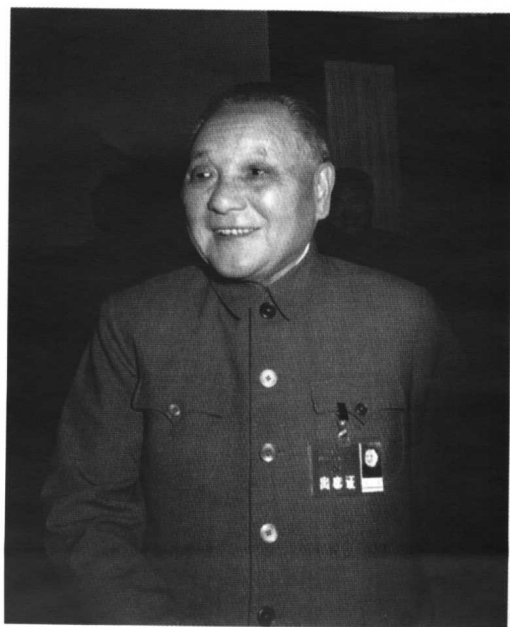
1987年邓小平出席十三大