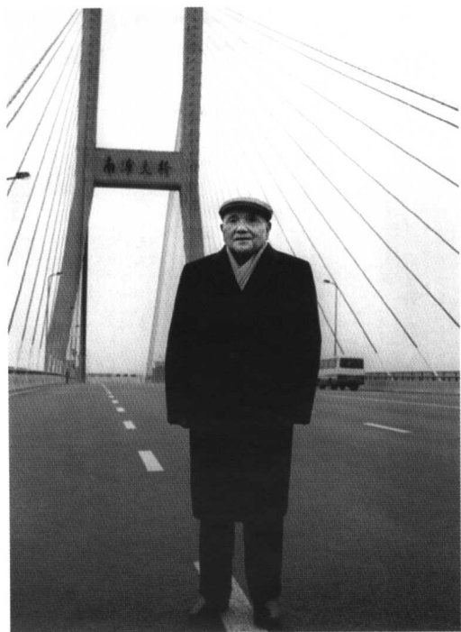
1992年邓小平在上海南浦大桥