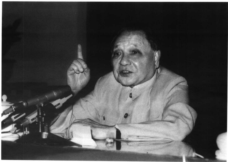
1985年6月4日，邓小平在中央军委扩大会议上宣布： 中国人民解放军三年内裁员额100万