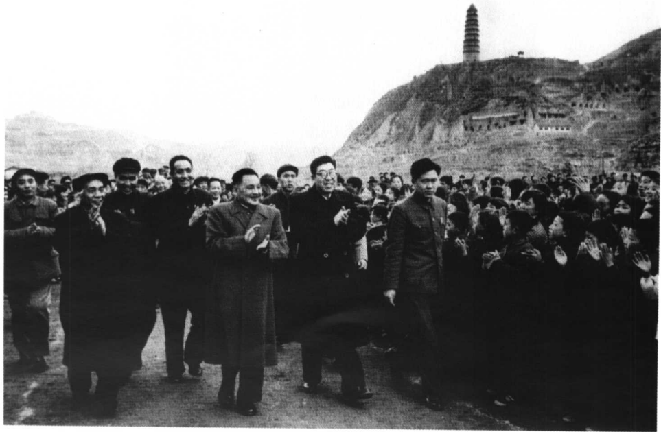
1966年4月，邓小平回到阔别多年的延安，受到延安人民的执烈欢迎