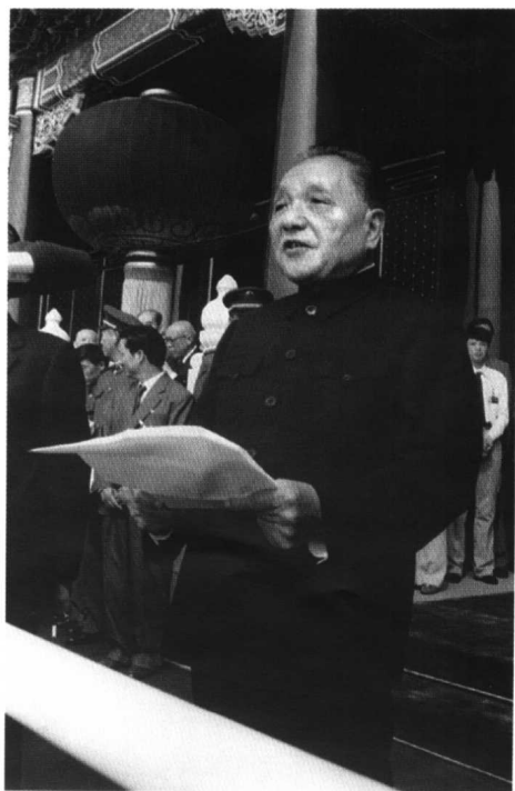
1984年10月1日，邓小平在国庆35周年庆典上发表讲话