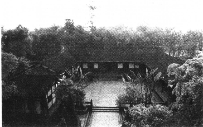
邓小平故居。1904年8月22日邓小平出生在这里

难，经常欠债。父亲过去在成都念书，也担任过县联防团长、乡联保主任等地方小官。他属旧社会的人，有旧社会的一些坏东西、坏作风。但他对旧社会不满，对我们兄弟俩参加革命，一直采取支持、拥护的态度，从来没有反对过。我们这个家的组成是比较复杂的，我母亲生了五个孩子：老大是大姐，叫邓先烈，老二就是邓小平，在男孩子中排行老大，我们都称他大哥。接下来就是我二姐，邓小平走后不久她就死了。再下来是我，1911年出生，行称老二。再下来是我三弟，叫邓蜀屏，解放后到重庆上革大，后到贵州地方工作，“文化大革命”中被逼死了。