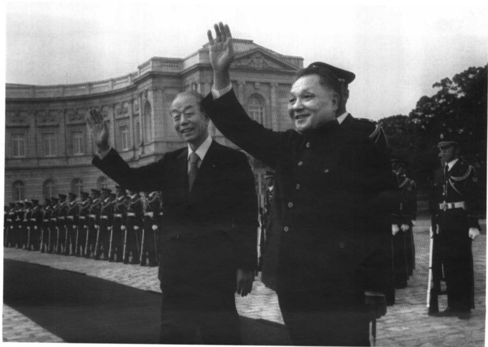
1978年10月邓小平访问日本