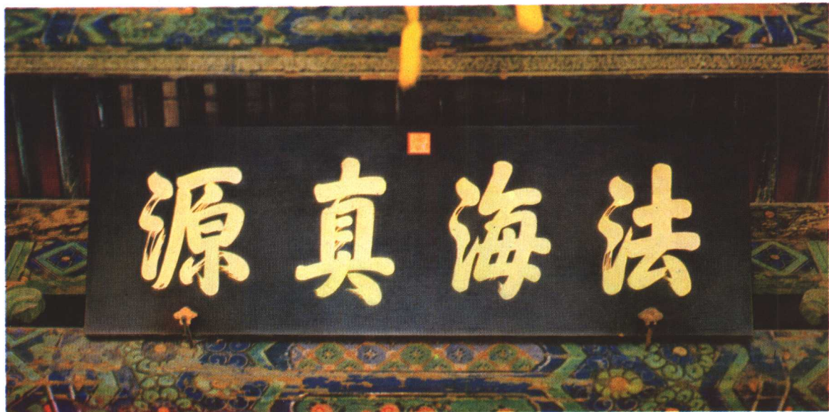
清乾隆帝（弘历）书匾