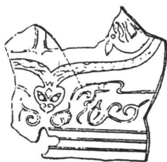
二里头文化的陶片上一头双身龙