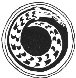
龙山文化的彩绘龙盘