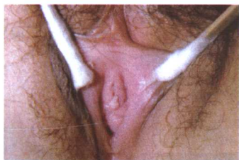
彩图11 尖锐湿疣 (女阴尿道口)