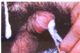
彩图8 一期梅毒 (包皮硬下疳)