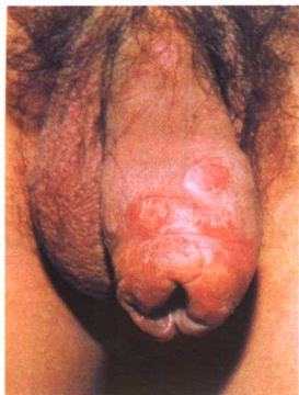
彩图9 二期梅毒 (包皮浸润性红斑)