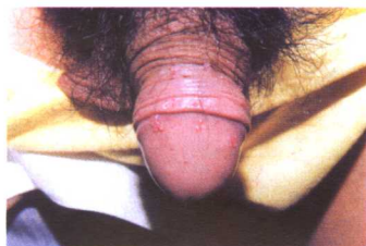
彩图12 尖锐湿疣 (龟头、包皮)