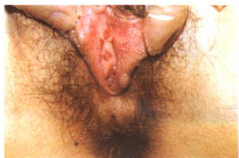
彩图7 一期梅毒 (左小阴唇下方硬下疳)