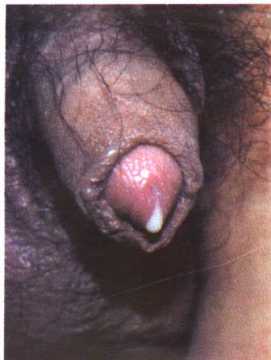
彩图10 淋病 (尿道口脓性分泌物)