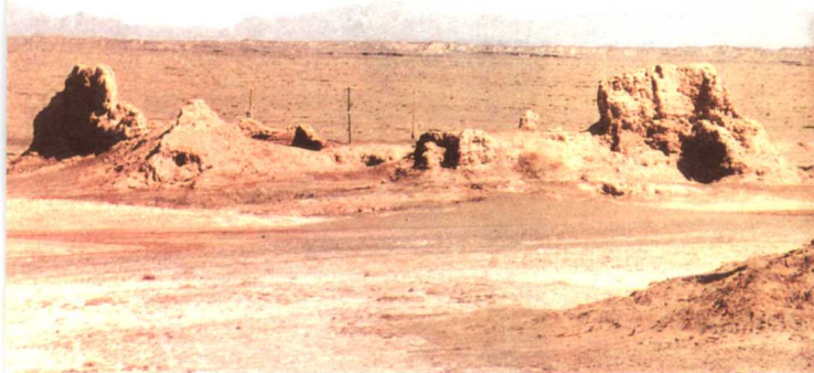
库车脱盖塔木馆驿

汉时龟兹—楼兰—敦煌这段“北道”东段路线记实的历史纪念碑。这段路经轮台东境库尔勒市的铁门关隘道经汉时焉耆、尉犁、危须、银山道至车师、高昌，再经河西走廊至长安。这即是魏晋以后中原通往西域“中道”的东段重要交通路线。