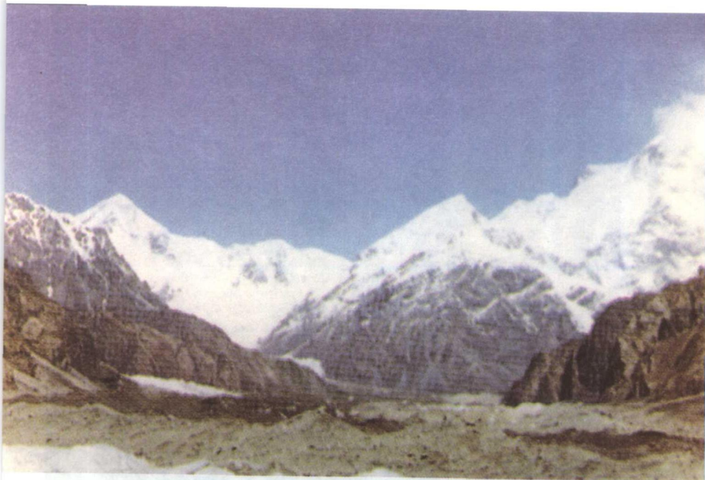
龟兹境内的天山(托木尔冰川)