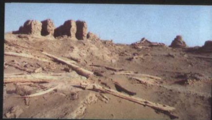
楼兰城内“三间房”遗址，普遍认为认为是楼兰的官署遗址