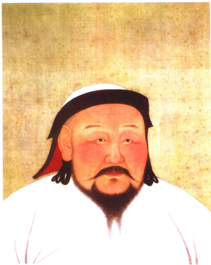
元世祖忽必烈画像