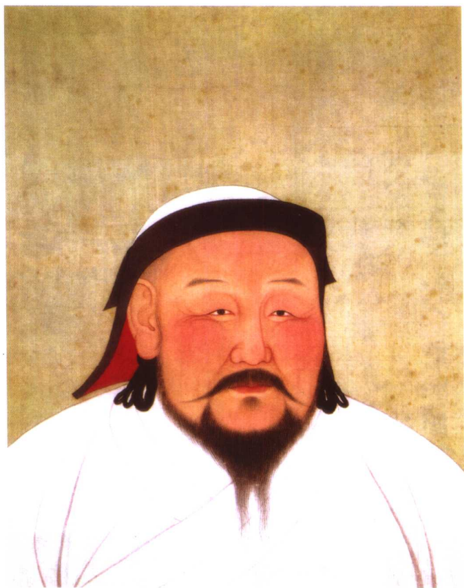
元世祖忽必烈画像