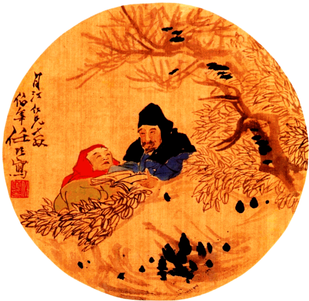
任伯年 課讀圖 27×27.5cm