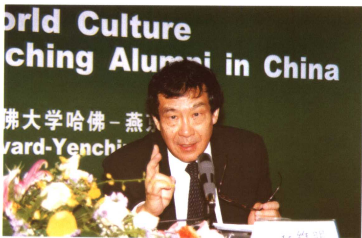
哈佛-燕京 学社社长杜维明 教授在研讨会上 发言