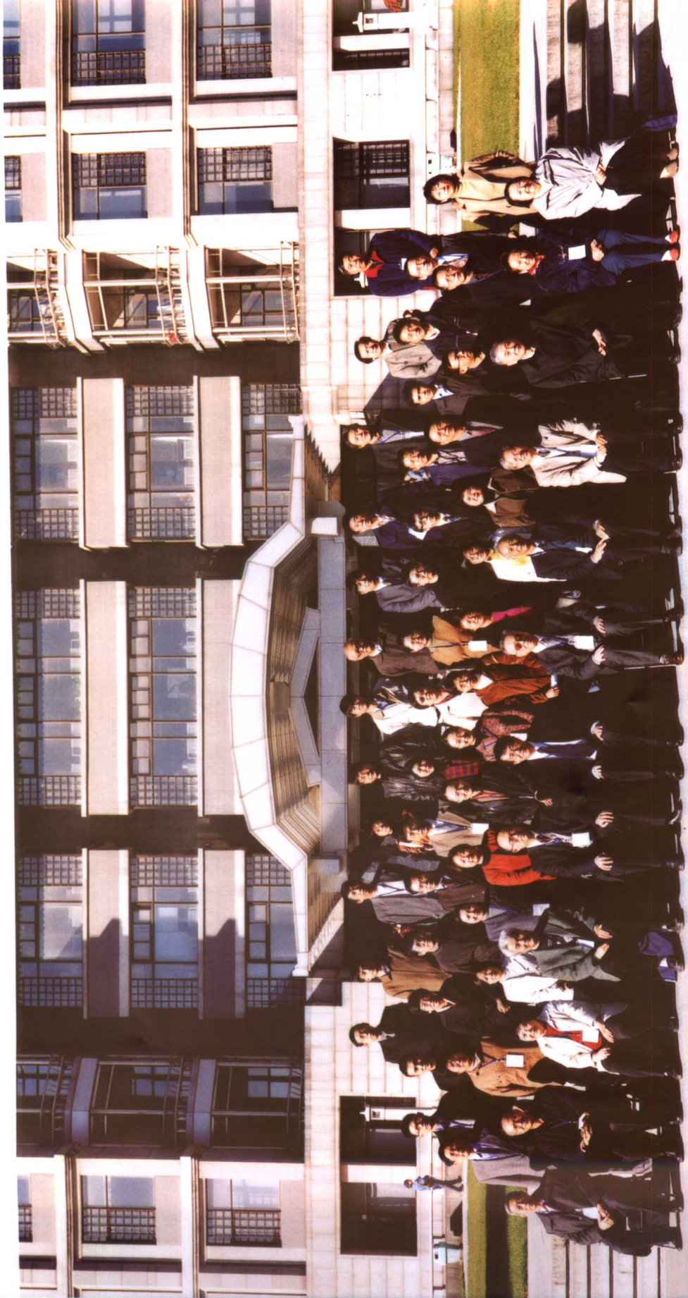
参加研讨会的全体人员合影