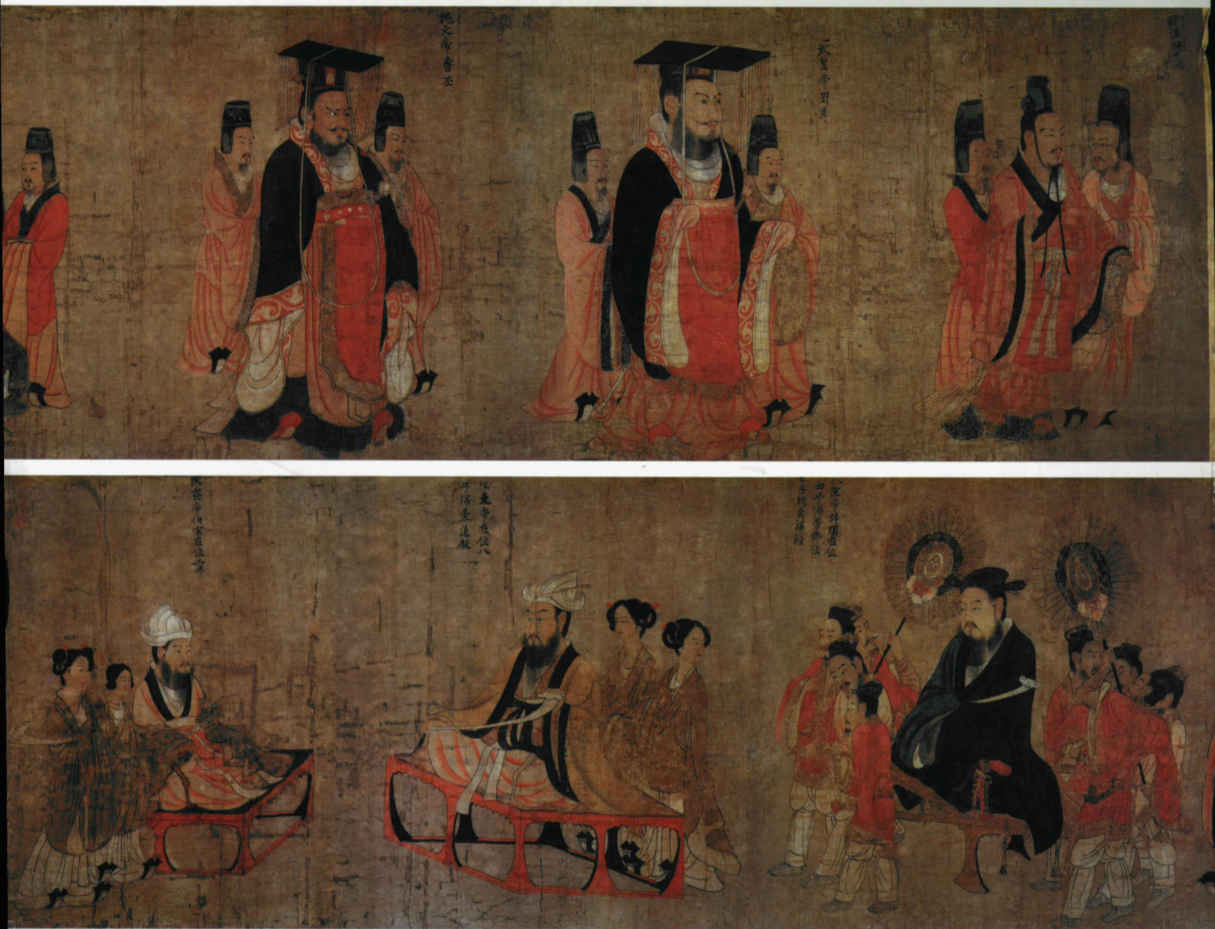
唐 阎立本 历代帝王图 卷 绢本 设色 纵五一·三厘米 横五三一厘米 美国波士顿美术博物馆藏

阎立本，是唐代著名的人物画家。约生于六〇一年，卒于六七三年，雍州万年（今陕西潼临县）人。作为唐太宗李世民高级官僚集团中的一员，阎立本曾担任过刑部侍郎、将作大匠、工部尚书、右丞相等要职。阎氏家族一向以丹青著名，其父阎毗、兄阎立德都是长于绘画、工艺和建筑的多面手。