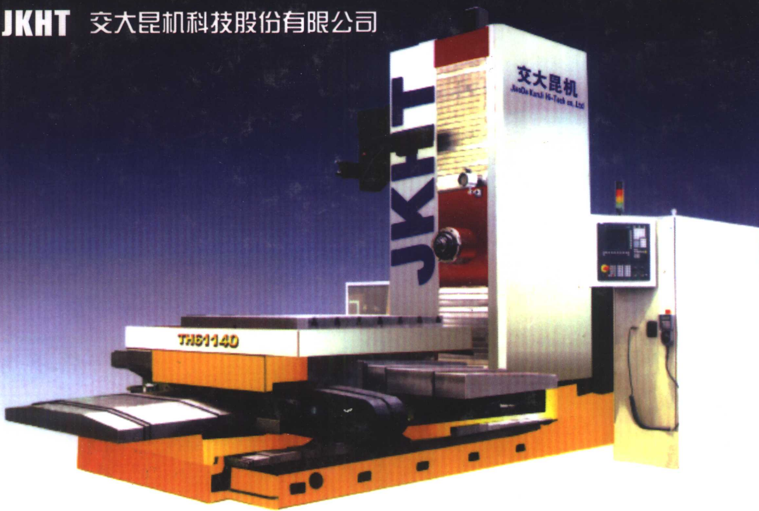
第十五届欧洲机床博览会参展产品