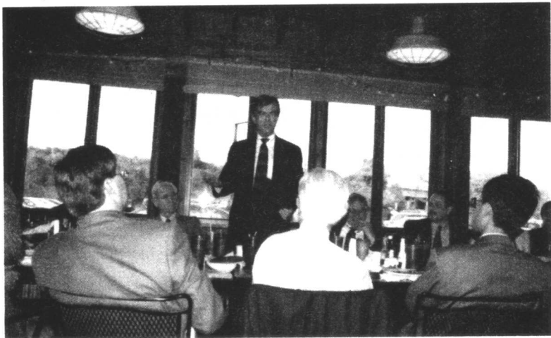
■ 大纽约文区的各市市长们聚会讨论区域协作问题

量市长下一周的活动安排和讨论政府机构的调整问题。后来我才知道，当天市长的活动从早上8点到晚上10点排得满满的。