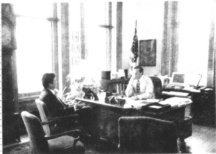
■ 作者与纽海文市市长在办公室交谈

我说，我们的毛泽东主席说过，没有调查就没有发言权，此事需要进一步的调查了解。或许这就是我这个助理的任务。