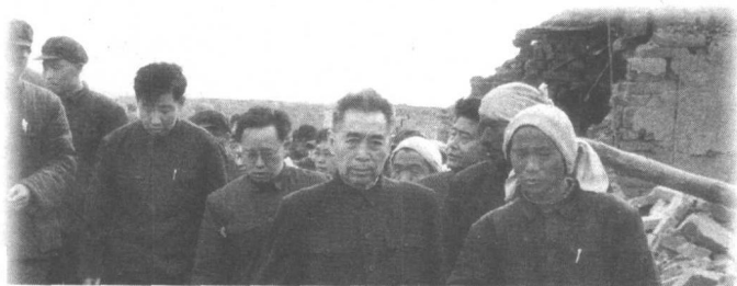
1966年3月8日，河北邢台地区发生强烈地震，周恩来总理前往灾区了解灾情。