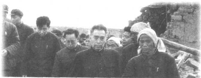
1966年3月8日，河北邢台地区发生强烈地震，周恩来总理前往灾区了解灾情。