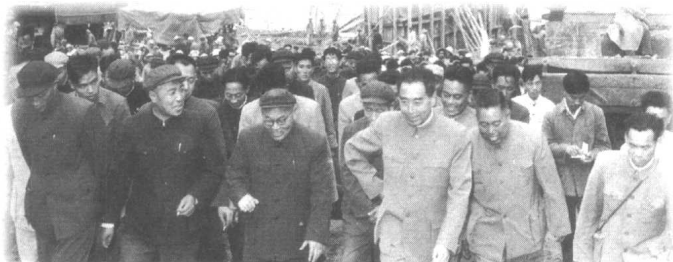
1959年10月，周恩来总理在黄河三门峡大坝工地视察。

走，抓住吊环，站在车当中。汽车开动后，拥挤中的乘客一时半会儿还没缓过神来。过了两三分钟，乘客们突然听到有人大喊：“哎呀！这不是周总理吗？”原来，这时站在周恩来对面的一个乘客发现了她。“总理？总理？！”车厢里立时沸腾起来了，许多人站起来给周恩来让座，不少人往他身边挤，有的把手伸过来。看到这种情景，随行的秘书和卫士心里很紧张，生怕人们不注意挤倒周恩来。这时，周恩来向大家挥动手臂，劝说乘客们：“请坐！请坐！别挤！别挤！不要动。”乘客们执意让周恩来坐下来，但周恩来坚决不肯。这时，一个乘客挤到他身边，握住他的手，激动地说：“总理，你那么