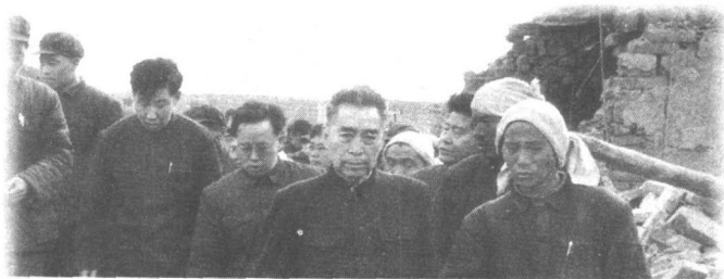
1966年3月8日，河北邢台地区发生强烈地震，周恩来总理前往灾区了解灾情。