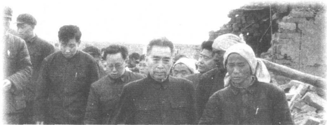
1966年3月8日，河北邢台地区发生强烈地震，周恩来总理前往灾区了解灾情。