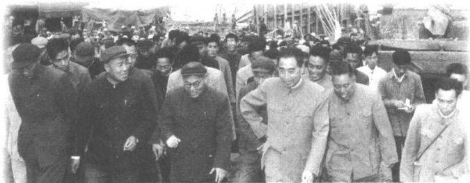
1959年10月，周恩来总理在黄河三门峡大坝工地视察。

1958年，党中央决定加速首都城市建设。它包括改造天安门广场和兴建著名的“十大建筑”。当时人力、物力、财力都相当紧张，但周恩来仍然指示：“一定要同时注意解决人民居住问题，今年北京建住宅的