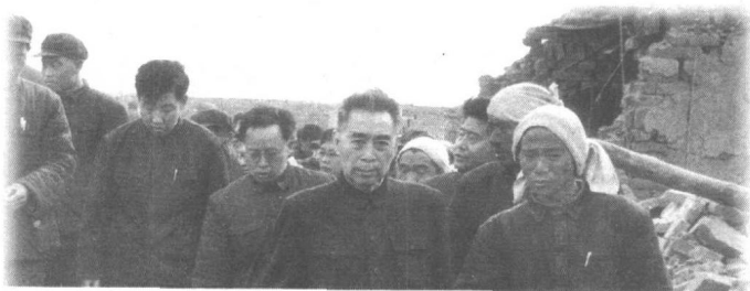
1966年3月8日，河北邢台地区发生强烈地震，周恩来总理前往灾区了解灾情。