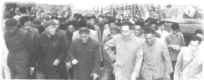
1959年10月，周恩来总理在黄河三门峡大坝工地视察。