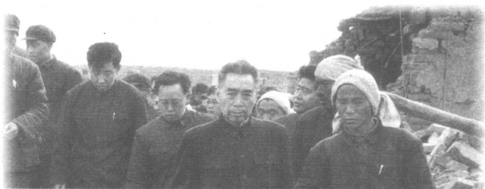
1966年3月8日，河北邢台地区发生强烈地震，周恩来总理前往灾区了解灾情。