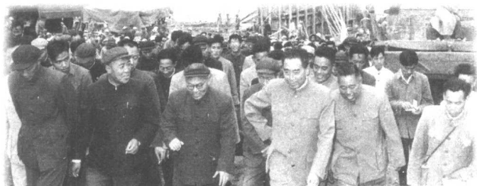
1959年10月，周恩来总理在黄河三门峡大坝工地视察。

为了解除饱受洪涝灾害的潮白河两岸人民的痛苦，周恩来曾亲自到潮河、白河河畔，为密云水库勘选坝址。密云水库工程上马后，1958年9月至1960年9月施工期间，周恩来多次到施工现场视察并看望建设者。到工地后，周恩来亲切地与民工交谈，询问他们的生活和健康状况，一再指出要注意民工劳逸结合的问题。他多次询问，民工的生活补贴发了没有，没发的要赶快发到他们手