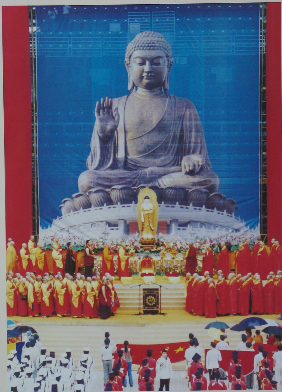
世界各國僧侶雲集慶祝香港「七·一」回歸祖國，場面盛大隆重。