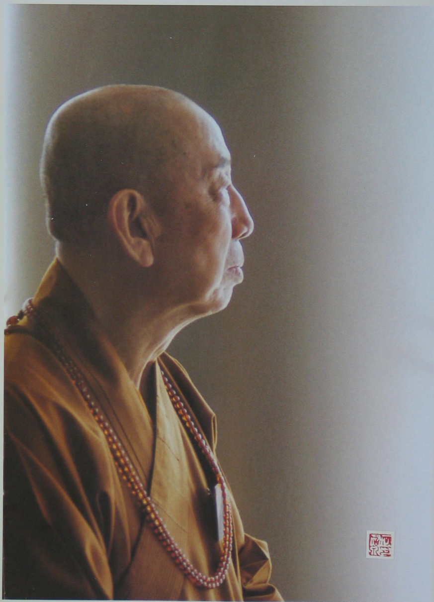
香港佛教聯合會會長覺光大師德相 (香港實施佛誕公眾假期的倡議者)