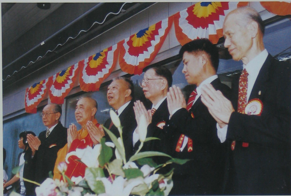
香港特區行政長官董建華與佛聯會會長覺光法師暨董事們合掌祝福