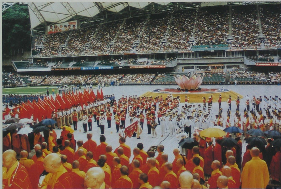
世界各國高僧參加香港回歸祖國盛大慶典儀式