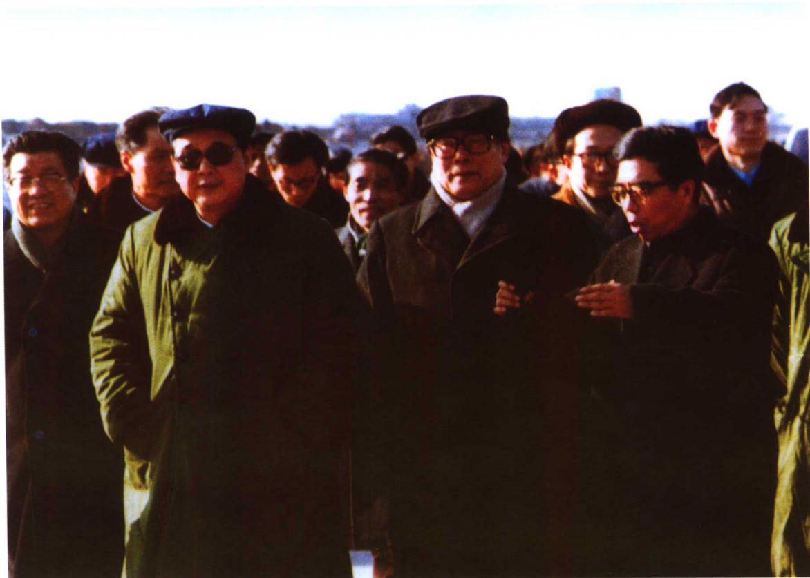
中央军委主席江泽民，李鹏视察秦山核电现场