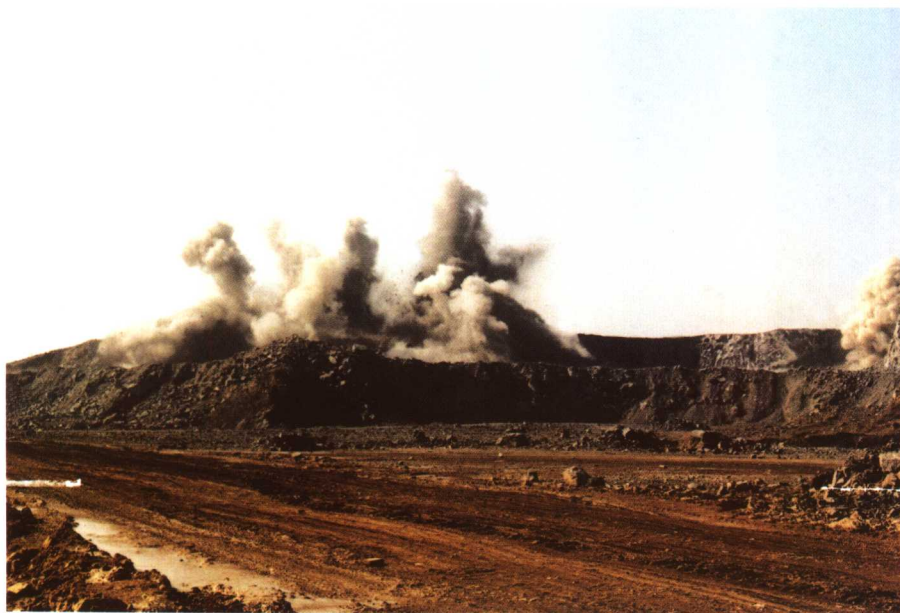
施工现场开挖爆破