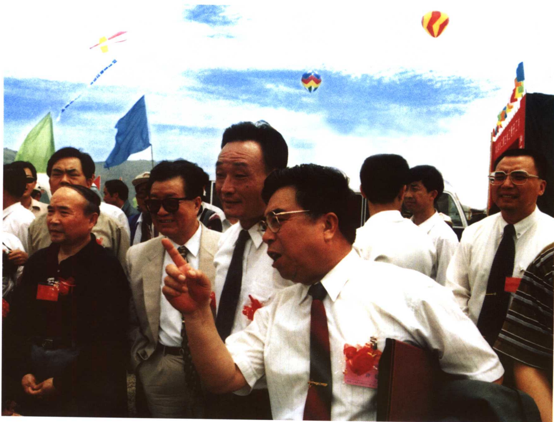
全国人大常委会委员长吴邦国在秦山第二核电厂施工现场视察