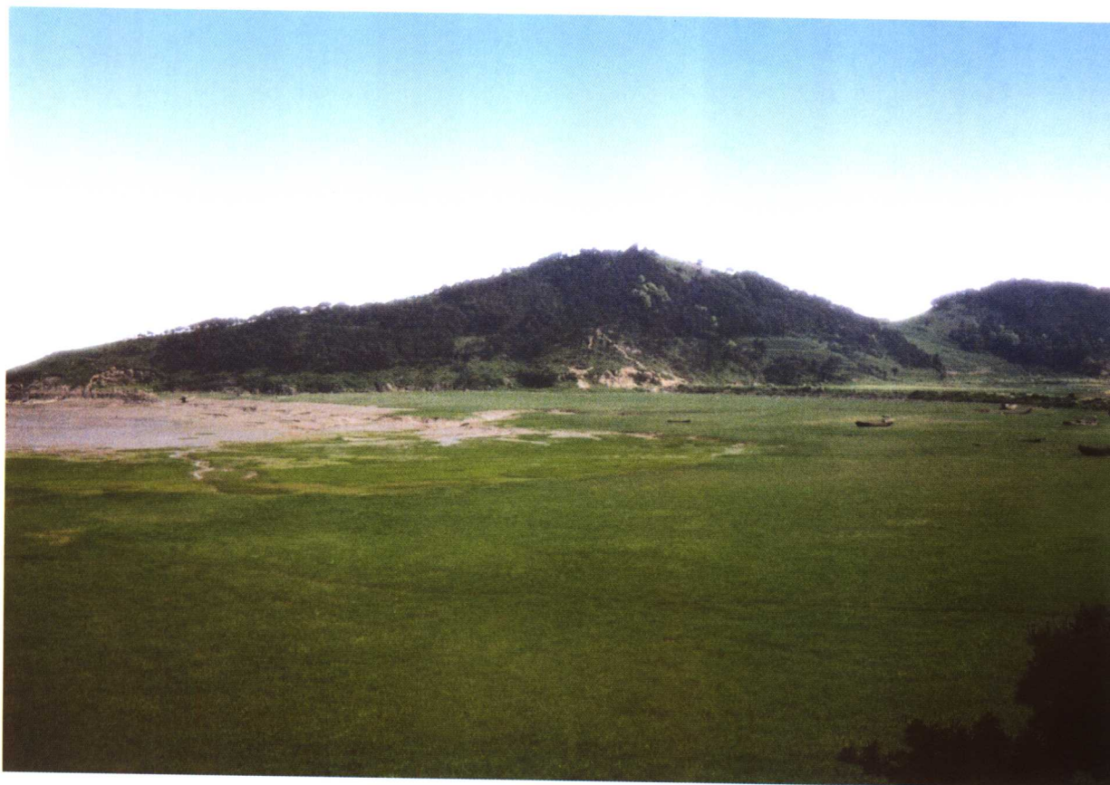
秦山第二核电厂厂址——杨柳山原貌