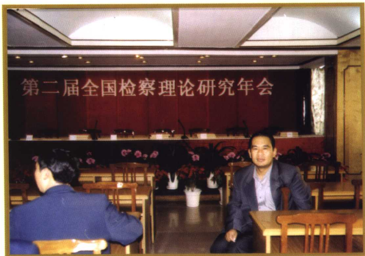
▲ 在广州参加第二届全国检察理论研究年会。