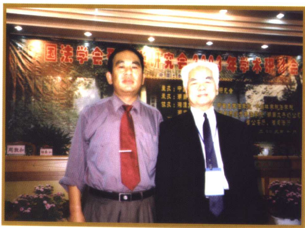
▲ 与学界泰斗高铭暄老先生在湖南合影。