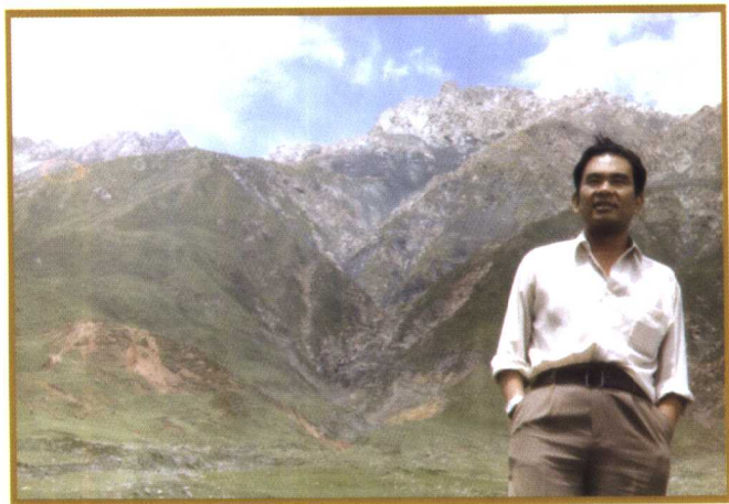
▲ 下乡途中。头顶蓝天，背靠群山， 感悟像时光一样苍凉和久远。