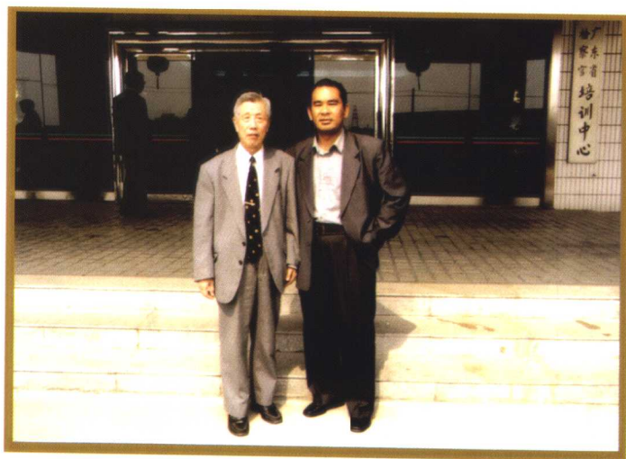
▲ 与学界泰斗马克昌老先生在广东合影。