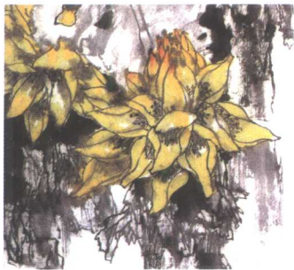
地涌金莲 2004年 纸本 90cm × 90cm