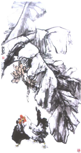
蕉荫 2004年 纸本 180cm × 90cm

以饱满者居多，但丰茂而不填满，灵动而不虚旷。他用笔有力，墨色丰富，综合多种技法，极力张扬水墨的表现力，一扫那种萧索哀愁、陈腐媚俗之风，呈现给我们的是花团锦簇、绚丽斑斓、清新向上的热烈情调。