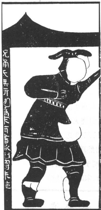
汉画像石上的 祝融氏(祝融 氏)像

号)”(《左传》昭公十七年);“炎帝为火师,姜姓其后也”(《左传》哀公九年);“炎帝作,钻燧生火,以熟荤腥,民食之无胃之病,而天下化之”(《管子·轻重戊》)。因为炎帝有这么大的恩德,所以死后便被奉为灶神:“炎帝于火,死而为灶。”(《淮南子·汜论训》)。