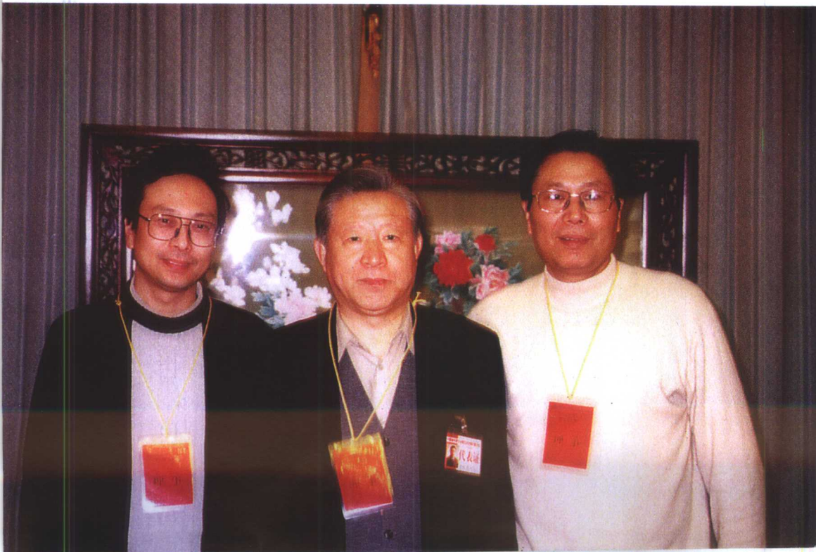
1999年作者在音代会上与音协主席、作曲家傅庚辰和作曲家臧云飞合照。