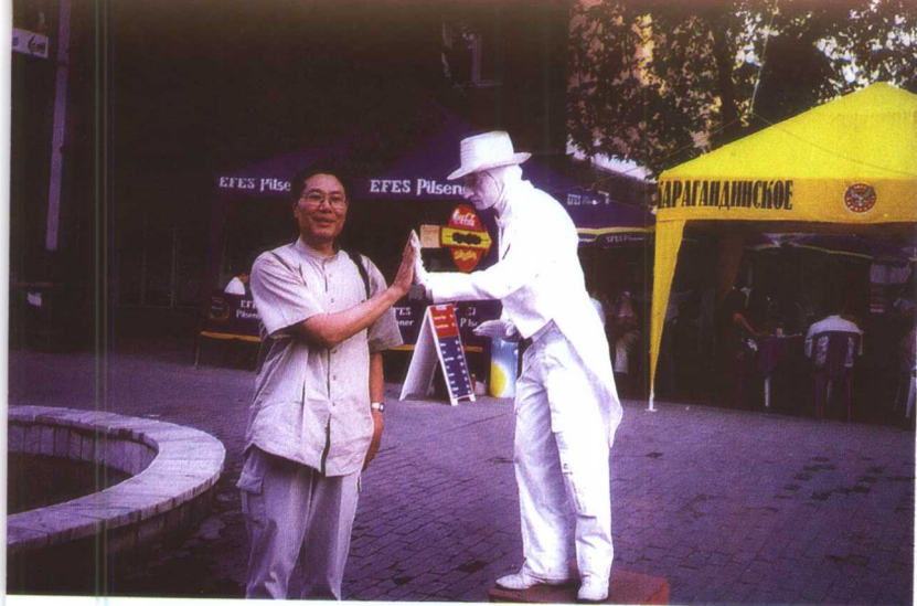
2000年作者在 哈萨克斯坦