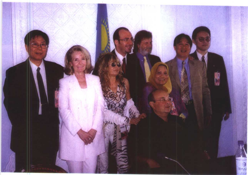
2000年作者参加 哈萨克斯坦国际流行 音乐节与评委会合影