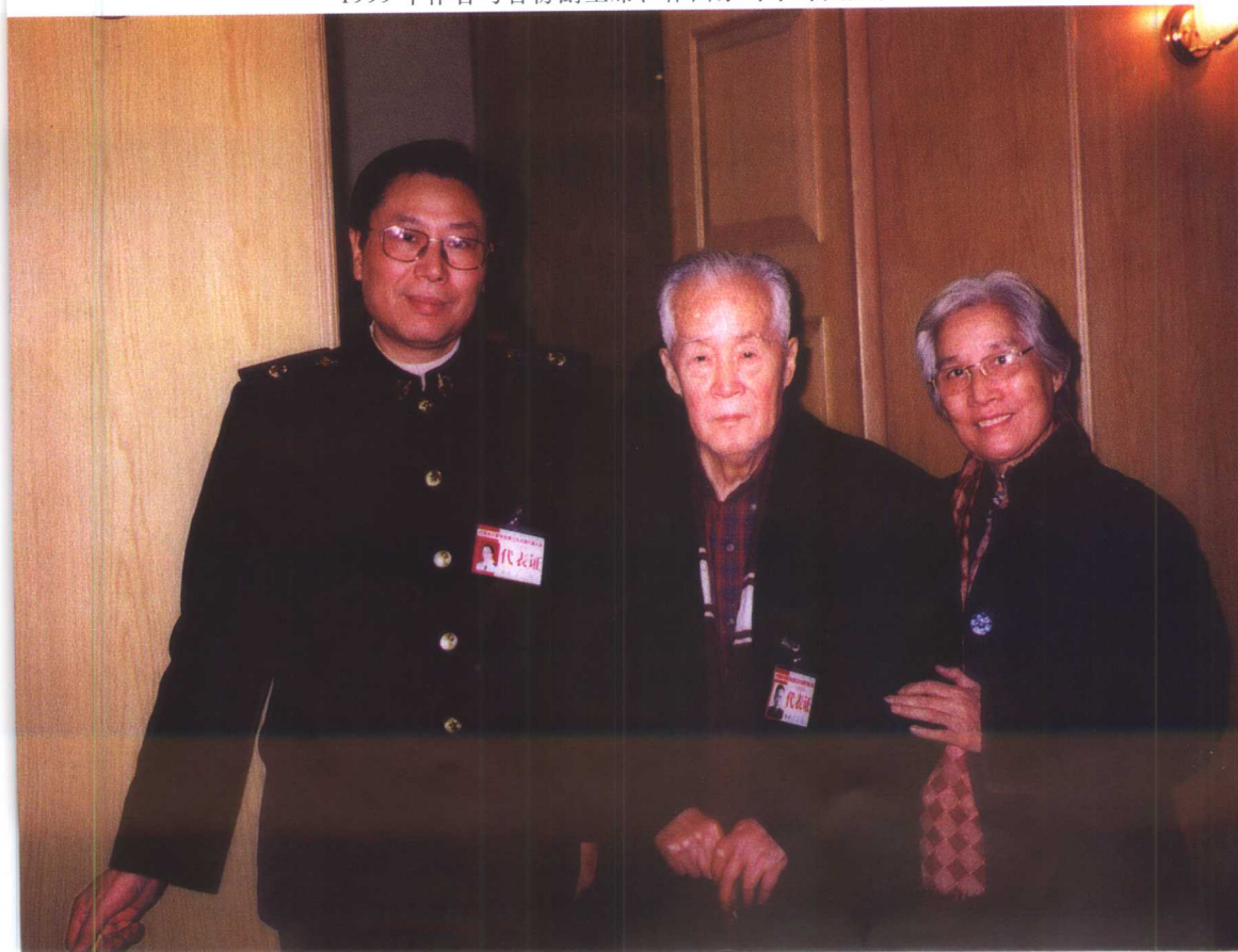
1999年作者与音协副主席、作曲家时乐濛夫妇。