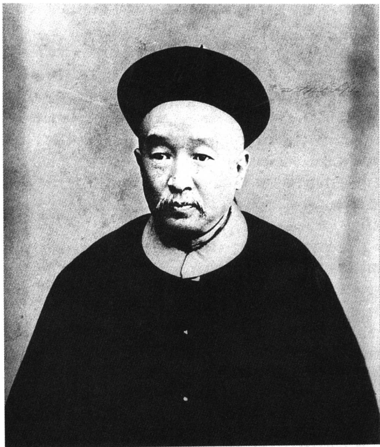
中国近代杰出的实业家、政治家盛宣怀。

北武昌盐法道(分管食盐产、运、销的副省长),又候补浙江道,成为朝廷外放地方官中的实力派。对于盛家来说更为重要的是,这期间适逢李鸿章在湖北奉命打“长毛”,盛康为其操办后勤军务,甚得赞赏,这就为后来他的儿子盛宣怀进入李鸿章幕府打下