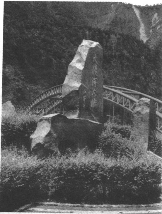
新建的大渡河大桥

1. 茶马古道是祖国统一的历史见证，是民族团结的象征。由藏汉等族人民开辟的这条道路，证明了西藏归属中国的历史必然性，证明了藏区与祖国天然的不可分割的关系，证明了藏族与汉族和其他兄弟民族间谁也离不开谁的必然性。它