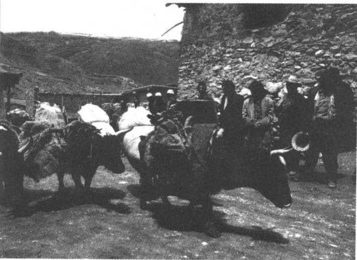
高原之舟——牦牛，也曾为茶马古道的畅通立下过汗马功劳。