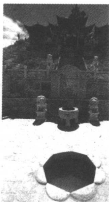
香格里拉龟山脚下的井泉，留下了许多茶马古道和马帮驮队的故事。

现在仔细一想，屈指已不能计算我行走茶马古道的趟数，更无法统计这些年在茶马古道上走过的里程。我已不记得曾经翻越过多少高山，涉过多少江河和溪流，经受过多少