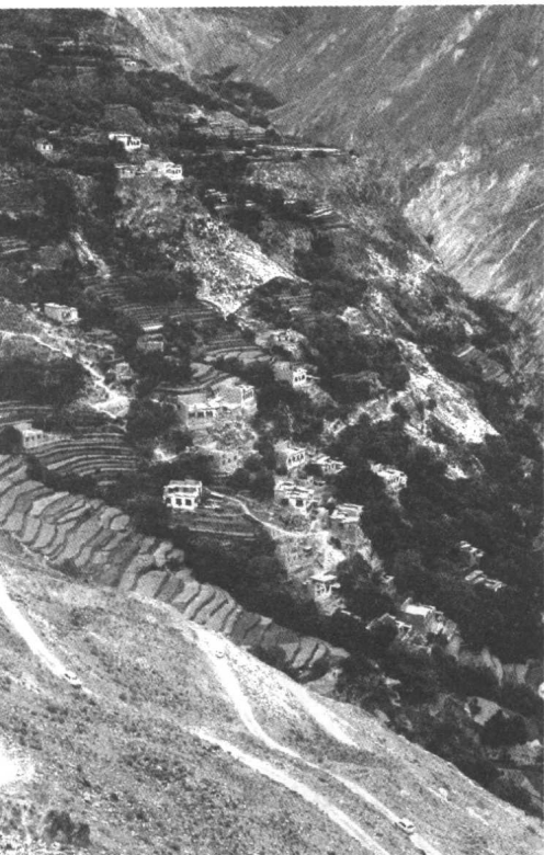
茶马古道是世界上最遥远、最高、最险峻的道路之一，它蛛网般地通向每一座村寨。

茶有必然的需要；另一方面，藏区虽不产茶，但与其毗邻的四川、云南等地却是盛产茶叶之乡。千百年来，四川、云南所产之茶源源不断地输入藏区，完全能满足藏族人民之需，而藏区的土特产品也随着茶叶输藏的贸易被运到内地，弥补了内地所缺。于是，一条以茶叶贸易为主的交通线，在藏汉民族商贩背夫、驮队、马帮的披荆斩棘努力下，在历代中央政府的支持下，被开辟出来。它像一条绿色的飘带，横亘于青藏高原与川、滇之间，蜿蜒曲折于“世界屋脊”之上。穿过崇山峻岭峡江长河，越过皑皑雪原、茫茫草地，像一条剪不断的纽带，把内地与藏区相连接；似一座跨越时空的金桥，把汉藏民族的兄弟情谊传送。由于唐代以来这种贸易关系主要是以内地之茶与藏区之马进行交换的形式进行，故历史上称之为“茶马互市”，或“茶马贸易”。伴随这一贸易而