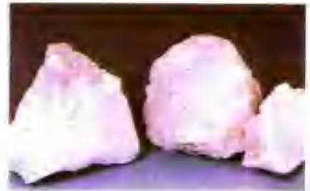
大结晶电熔镁砂 98.5% Fused magnesia with large crystal 98.5%