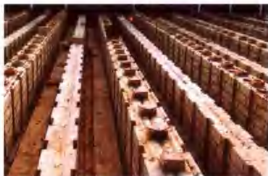
为上海宝钢3期工程5A焦炉提供的硅砖

为了满足客户不断变化的要求,正在努力通过新材料和产品的开发提供给客户高质量的产品,愿与五洲朋友建立信赖互惠关系,希望在投资经营、技术交流、市场开发方面予以合作,欢迎国内外宾朋前来会商合作事宜。