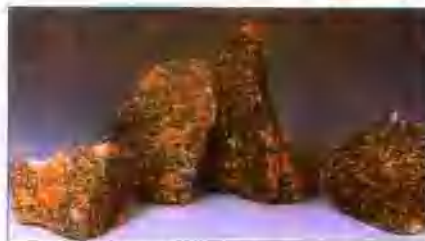
电熔镁砂 MgO98% Fused magnesia MgO98%