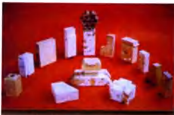
硅质系列耐火材料 Silica Series Refractories

Luoyang Refractory Group Co., Ltd. (LARG) was established in 1958. Total capital is 740 million Yuan. It has 2776 employees, including 855 technicians. The output is 160 thousands per year, including 65 thousand ton alumina-silica brick, magnesia alumina brick and magnesia-silicate bricks, 50 thousand ton silica brick, high quality glass kiln silica brick, insulating silica brick, 40 thousand ton high alumina brick, high quality alumina brick, 10 thousand ton industrial refractories, 25 thousand ton electric fused refractories (fused AZS, fused mag-chrome), 2 thousand sliding gear (AZS), C, Al_2O_3, SiO_2-C and 4 thousand ton special quality SiC special refractories.