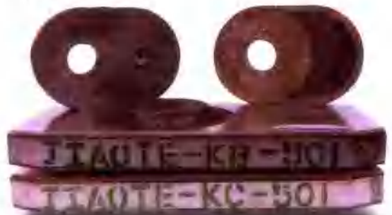
铝碳质滑板 Al_2O_3-C Sliding Gate