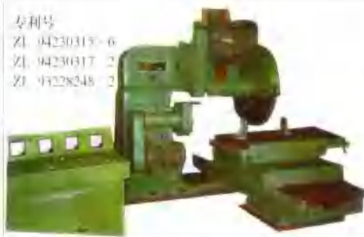
悬臂式全方位切割机

专利号 ZL 94230315 6 ZL 94230317 2 ZL 93228248 2