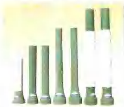
铝碳质长水口 Al_2O_3-C LONG Nozzles