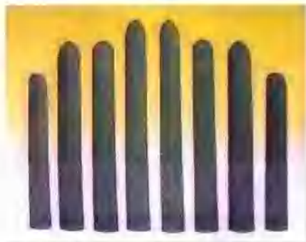
铝碳质整体塞棒 Al_2O_3-C Monoblock Stoppers

地址：中国山东省胶州市兰州东路188号 电话：86-532-7212409 7232641 传真：86-532-7213390 邮编：266300