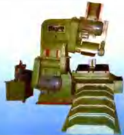
悬臂式双向平侧铣磨砖机