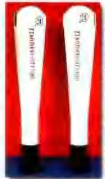
铝碳锆质浸入式水口 Al_2O_3-C-ZrO_2 Submerged Nozzles