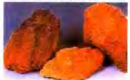
大结晶黄皮砂 96% Yellow magnesia with large crystal 96%