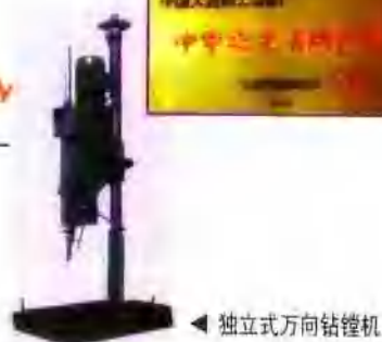
独立式万向钻镗机