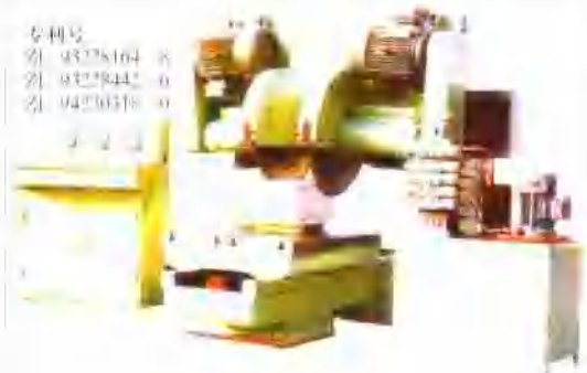
双向可变角度切割铣磨砖