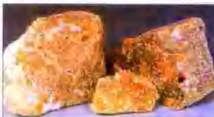
低铁电熔镁砂 MgO97% Fused magnesia With low ferro content MgO97%