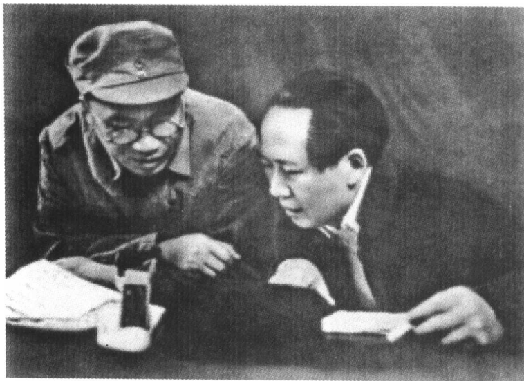
1945年夏,毛泽东与朱德在研究八路军、新四军及其他抗日人民 武装对日军作战形势。