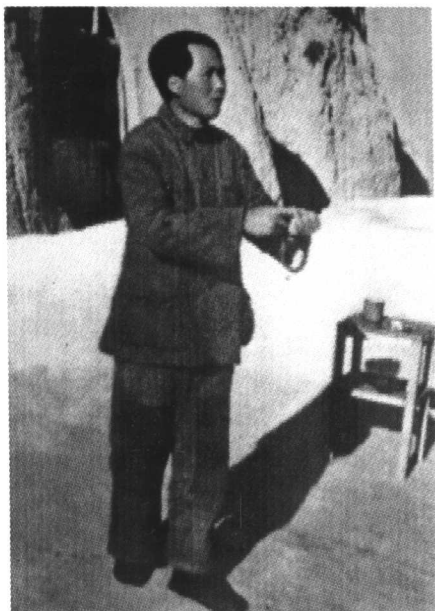
1942年3月,毛泽东在延安 为干部作报告。