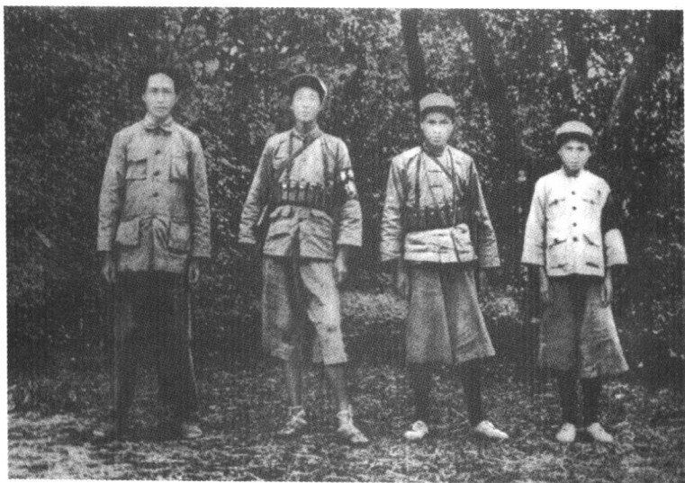
毛泽东同志在瑞金与红军战士合影。