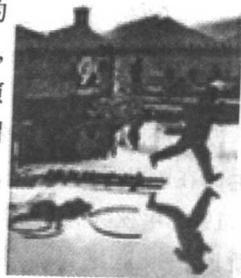
图 1-10 《巴黎圣拉萨车站后方》

为水中的倒影使这张照片成为布勒松的代表作，我们的学生拍摄过很多类似的图片。仔细观察这张照片后我们发现，照片左边围墙上的海报有一个芭蕾舞演员腾空跃起的动作，与右边一个戴礼帽绅士腾空跃起的动作相似而方向相反。这恰恰是此照片的精彩之处。这张照片恰恰体现了纪实摄影的多义性表达，请同学们思考一下照片的内涵。