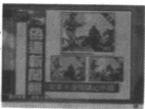
图 1-1 洛杉矶时报

坚持新闻事实的真实在今天显得尤为重要。随着计算机技术的进步，数码影像已经越来越广泛地渗透到新闻传播领域，数码相机、笔记本电脑与手机已经是现代摄影记者的标准装备，这极大地提高了新闻图片传输速度，几分钟之内