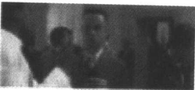
图 1-2 阿甘正传

内就可以把拍好的图片传回报社，新闻时效性得到了空前提高。然而凡事都有利有弊，方便快捷是数码技术的优势，但也带来了一些弊端，比如，用一些图像处理软件可以很方便地制造出虚拟时间和空间中发生的人和事，以假乱真。2003 年的 4 月 4 日，正当报道海湾战争的新闻大战如火如荼的时候，媒介本身也出现了一个爆炸性的丑闻，一个有着 25 年新闻摄影经历的资深记者布莱恩沃斯基被《洛杉矶时报》解雇了，原因是一张经过电脑合成的虚假新闻照片。摄影记者将士兵用枪指向平民的影像和抱着孩子的男人的影像合成在一张照片里，未明真相的图片编辑一度被照片所蕴涵的影像力量所震撼，然而纸包不住火，编辑的兴奋没有持续很久，事实便被揭露。洛杉矶时报的图片编辑对记者的做法表示愤慨，“他的行为完全不能接受，他损害了读者对我们的信任。如果我们的读者不再信任我们，那我们将一无所有。”类似的情况也可能会出现在电视新闻领域，因为数字技术已经极大地满足了人们追求更具冲击力影像的欲望。