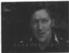
图 1-9 尼尔戴维斯

1985年秋天，《新闻联播》中播出了一条让人过目难忘的电视新闻，报道泰国发生的一次军事政变。只见屏幕上一辆军车驶过，坦克上的士兵在扫射，背景是泰国王宫，突然画面一抖，慢慢地歪倒在地上，但摄像机仍在转动，我们看到歪倒的画面中士兵在冲击。为了拍摄到军事政变的真实现场，美国全国广播公司驻曼谷首席记者尼尔戴维斯在报道中以身殉职。关