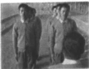
图 1-3 胖连长和他的连队

1988年第九期《中国记者》杂志上发表了一篇文章《失真》，作者孙佑文同志针对当年全国十佳新闻摄影记者评选活动中暴露的问题指出，这次十佳评选的某些参赛图片乃至整个评选活动是“用真实的材料写出的失实报道”。