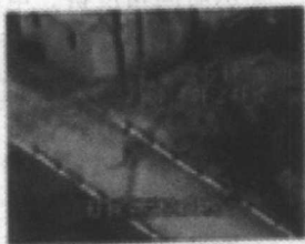
图 1-12 潜伏行动

《潜伏行动》是海南武警总队的电视记者们拍摄的一部优秀纪录片，该片真实地记录了武警战士的一次围捕行动。参与拍摄的记者跟随战士们经过长途奔波来到了黑帮分子经常出没的地方，为了将匪首一举抓获，他们和武警战士们潜伏了一天一宿，等待的过程中，记者忍受住饥渴困倦和蚊虫的侵袭，最后终于将武警战士勇擒匪首的过程完整记录在镜头中。在等待的过程中，记者必须积极发挥主观能动性，克服长时间相对静止的事