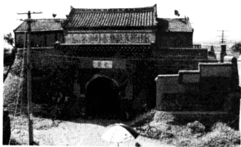
图为位于即墨市的 雄崖所故城遗址， 建于明代，现为市级 文物保护单位。