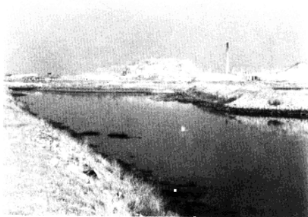
图为元明之际开 凿的马濠运河。