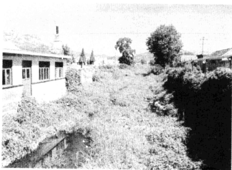
古 灵 山 卫 运 河