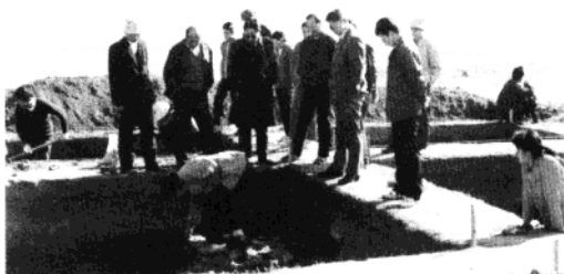
图为考古人员在平度东岳石文化遗址进行的文物发掘保护现场。