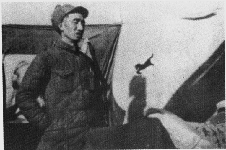
1943年，抗日军政大学校长徐向前在给学员作报告。