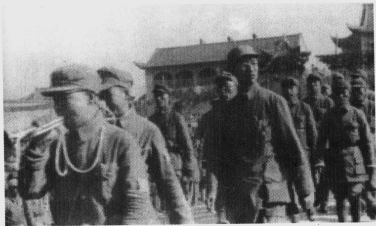
1948年临汾战役后，徐向前司令员（前右）检阅被授予“临汾旅”光荣称号的华北第1兵团23旅。